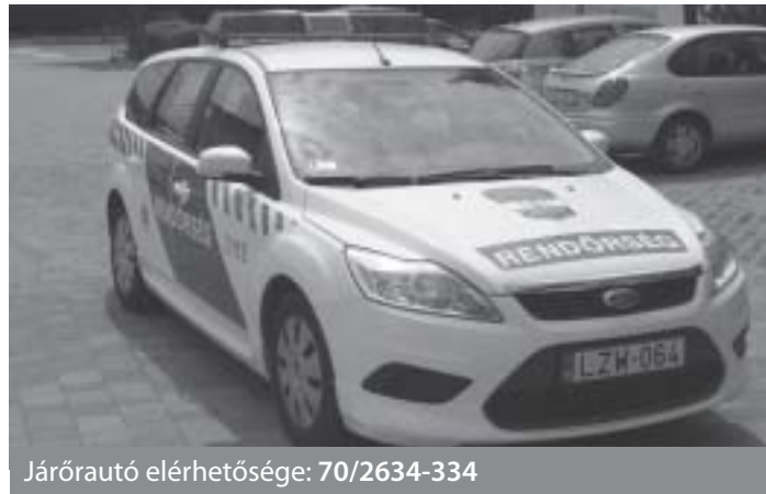
Járőrautó elérhetősége: 70/2634-334

mányzat pedig járőrautó vásárlásával járult hozzá a fejlesztéshez, amit átadtunk a rendőrségnek járőrszolgálatra, a két csömöri körzeti megbízott kizárólagos használatára.