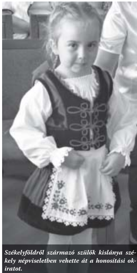
Székelyföldről származó szülők kislánya székely népviseletben vehette át a honosítási okiratot.

Ezúttal is kárpátaljaiak és erdélyiek váltak magyar állampolgárrá, településünkön vajdaságiak, illetve felvidékiek még nem tettek esküt. A Csömörön magyar állampolgárságot kapók többnyire helyi kötődésűek, itt telepedtek le, de előfordult már, hogy határon túl élő családtagok is itt kérvényezték az állampolgárságot itt élő rokonuk miatt.