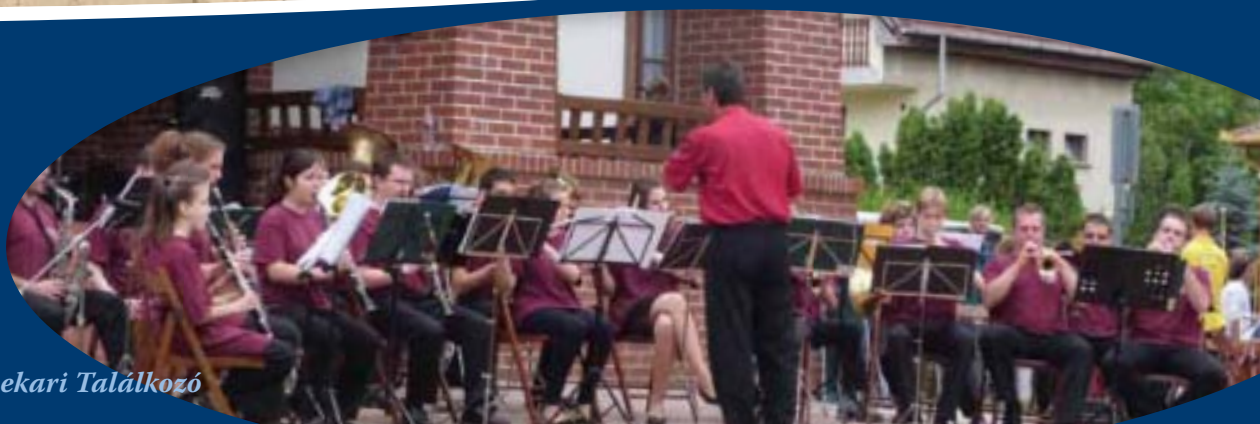
I. Csömöri Fúvószenekari Találkozó