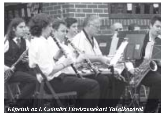
Képeink az I. Csömöri Fúvószenekari Találkozóóról