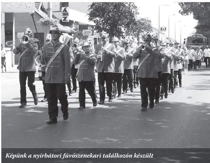
Képiünk a nyírbátori fúvószenekari találkozón készült

A zenei élményről rossz idő esetén sem kell lemondani, hiszen akkor a művelődési házban tartják meg az eseményt.