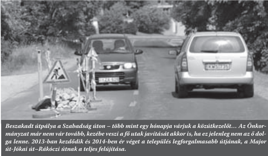
Beszakadt útpálya a Szabadság úton – több mint egy hónapja várjuk a közútkezelőt... Az Önkormányzat már nem vár tovább, kezébe veszi a fő utak javítását akkor is, ha ez jelenleg nem az ő dolga lenne. 2013-ban kezdődik és 2014-ben ér véget a település legforgalmasabb útjának, a Major út-Jókai út-Rákóczi útnak a teljes felújítása.