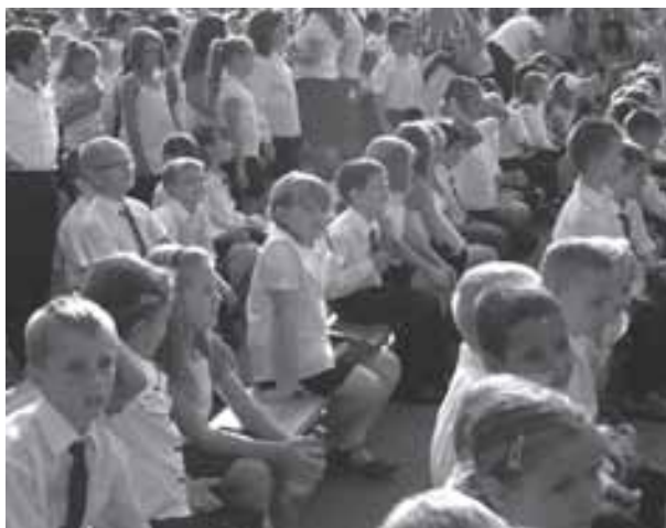
Csömöri iskolások

Újabb iskolai célú fejlesztésre szavazott meg mintegy 3,5 millió forintot a képviselő-testület. A költségvetésen belüli átcsoportosítás eredményeként a sportszarnokban modern térelváltó függönyöket szerelnek fel, így a mindennapos iskolai testnevelés Csömörön a lehető legideálisabb körülmények között valósulhat meg. Az ez év elején államosított helyi általános iskola így önkormányzati segítséggel tehet eleget a törvényben előírt kötelezettségeinek.