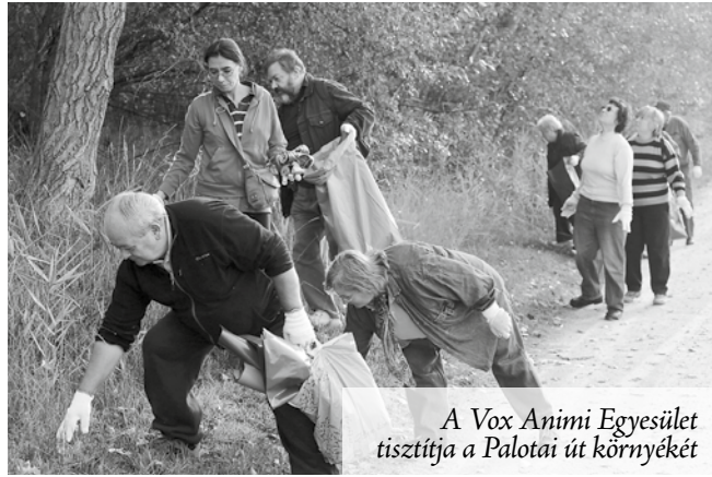
A Vox Animi Egyesület tisztítja a Palotai út környékét

Október 12-én ismét nagyszabású civil szemétszedést szerveztek a faluban, melyen a Kistarcsai út, Palotai út, Bulgárkert, Vasút sor, Szedervölgyi erdő, Kálvária, Vízműsor és Majorszegi településrészeket és környéküket tisztították meg községünk lelkes lakói. Az akcióban a csömöri egyesületek és szervezetek, a Civil Egyesület, az Evangélikus Gyülekezet, a Polgárőr Egyesület, a Vox Animi Egyesület, a Hit