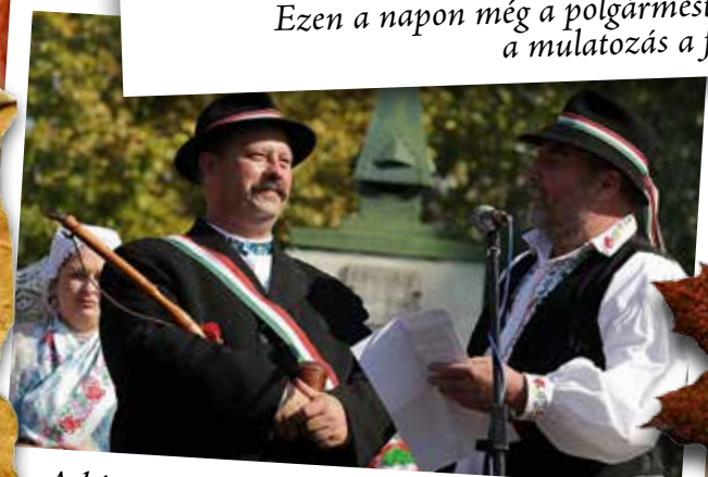
A bíró átveszi a bíráskodáshoz elengedhetetlen pipát, a bölcsesség, megfontoltság jelképét.