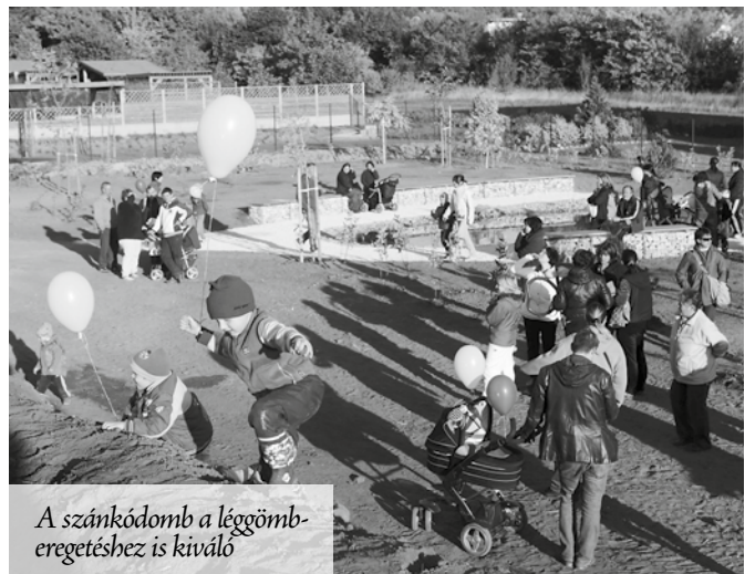
A szánkódomb a léggömberegetéshez is kiváló

Október elejétől pihenőpark és játszótér várja a Laky sarok környékén élő családokat. Az önkormányzat a Csömöri Község gondnokság közreműködésével a Laky-parkban játszótér és pihenőparkot létesített a településrészen élő családok számára, melyet október 4-én délután vehettek birtokba a gyerekek. A játszótér és park átadására a környékbeli lakók is meghívást kaptak, a gyerekeket az új játékok mellett bábelőadás és bohóc szórakoztatta, a program közös léggömberegetéssel zárult.