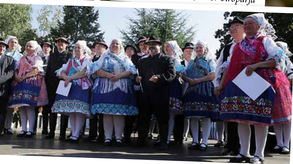
Együtt a bírópárok a főtér színpadán.