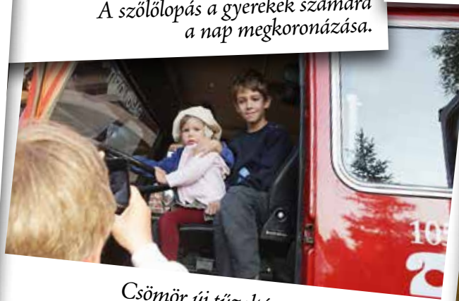
Csömör új tűzoltóautóját a gyerekek is kipróbálhatták a mulatságon.