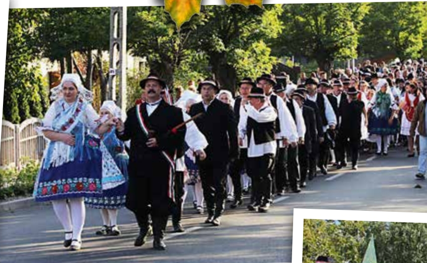
A vidám menet visszaérkezik a főtérrre.