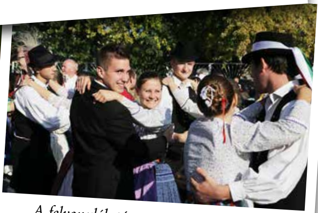
A felvonulók táncra perdülnek a Béke téren.