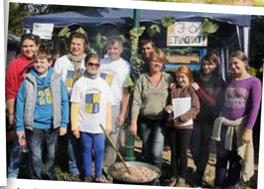
A „Jó étvágyat” csapat, a tavalyi egyik első helyezett. Saját elmondásuk szerint nem a verseny miatt jöttek, hanem nyerni. Borral és musttal készült az isteni szüreti tokány, a címvédéshez azonban kevésnek bizonyult.