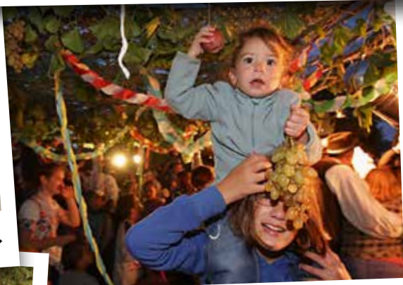
A szőlőlopás a gyerekek számára a nap megkoronázása.