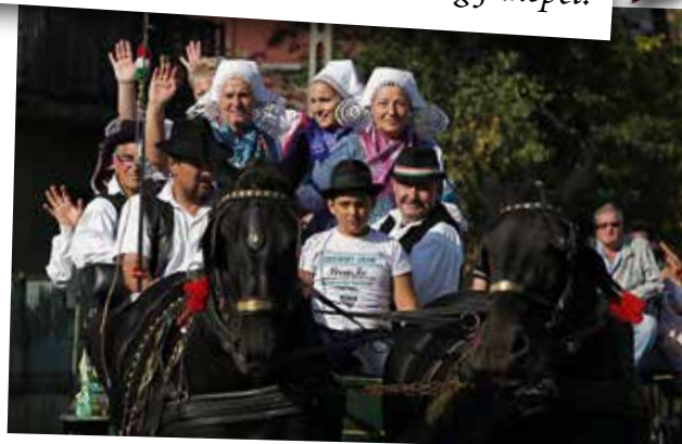
Elindulnak a lovas kocsik, hogy körbejárják a falut.