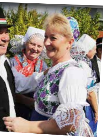
zsef, az 1995-ös év bírója