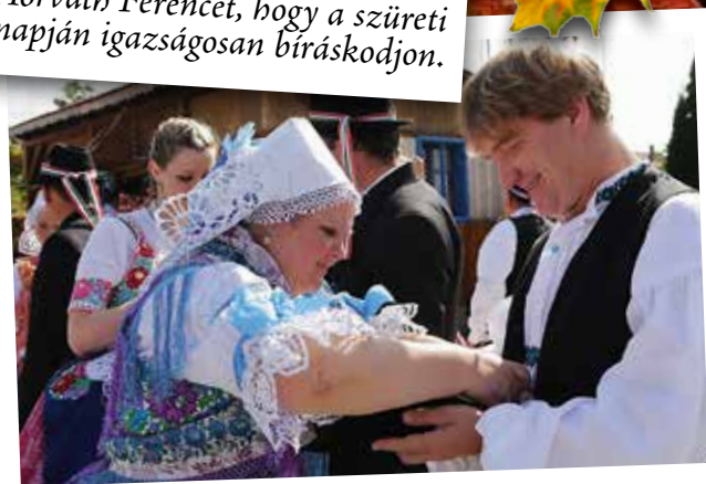
Ezen a napon még a polgármesternek is a mulatozás a feladata.