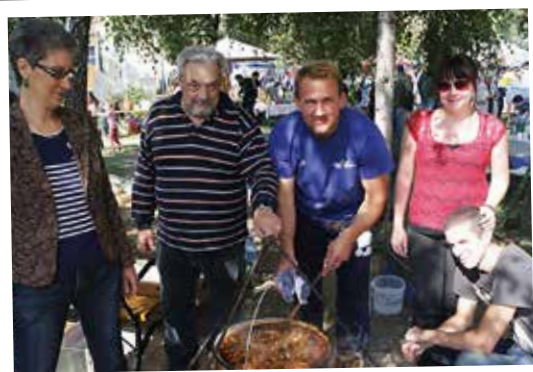
A Csömöri Sportcsarnok brigád büszkén hirdette, hogy sportolni már tudnak, főzni most tanulnak. A kezdés nem is rossz...Hajrá!