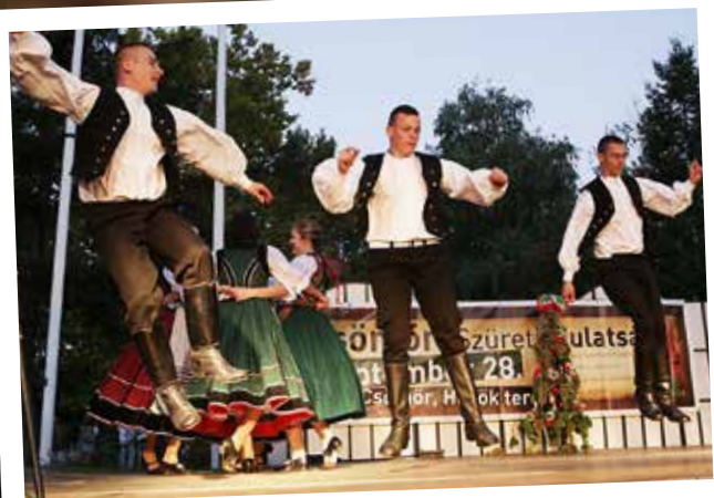
Többeknek a lába sem éri a földet a táncban.