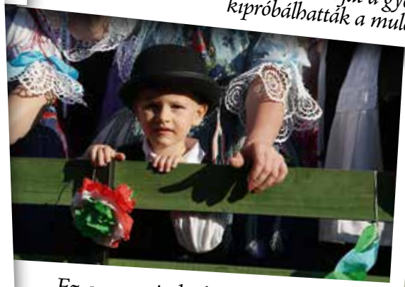
Ez a nap mindenki mulatsága, kicsiké...