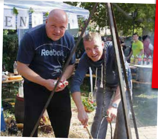
A „Legendák” beharangozott fantasztikus sertéspörköltjéből egy kanálnyi sem maradt, hogy megkóstoljam, így azt, hogy jó hírének alapja igaz volt, vagy legenda, még én sem tudom biztosan.