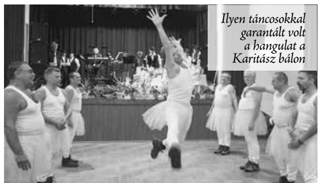
Ilyen táncosokkal garantált volt a hangulat a Karitászi bálon