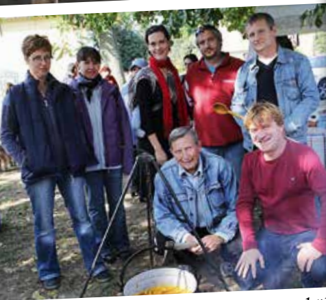
A Civilek tárkonyos-parajos köles-levese a vegetáriánusok kedvence lett.