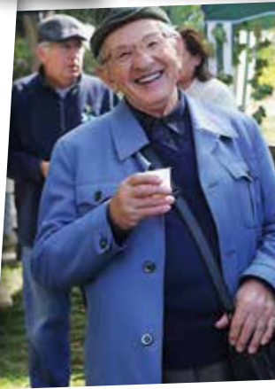
...és időseké egyaránt.