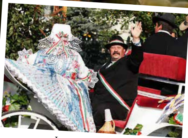
Integet a bíró az ünneplő népnek...