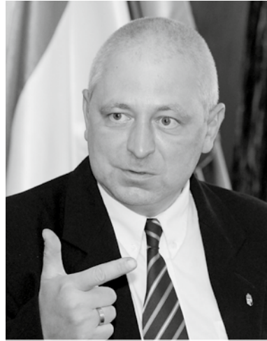
„A csömöri kollégáim jól dolgoznak”

Az a cél, hogy 2014-től egyablakos ügyintézés működjön Magyarországon, vagy-