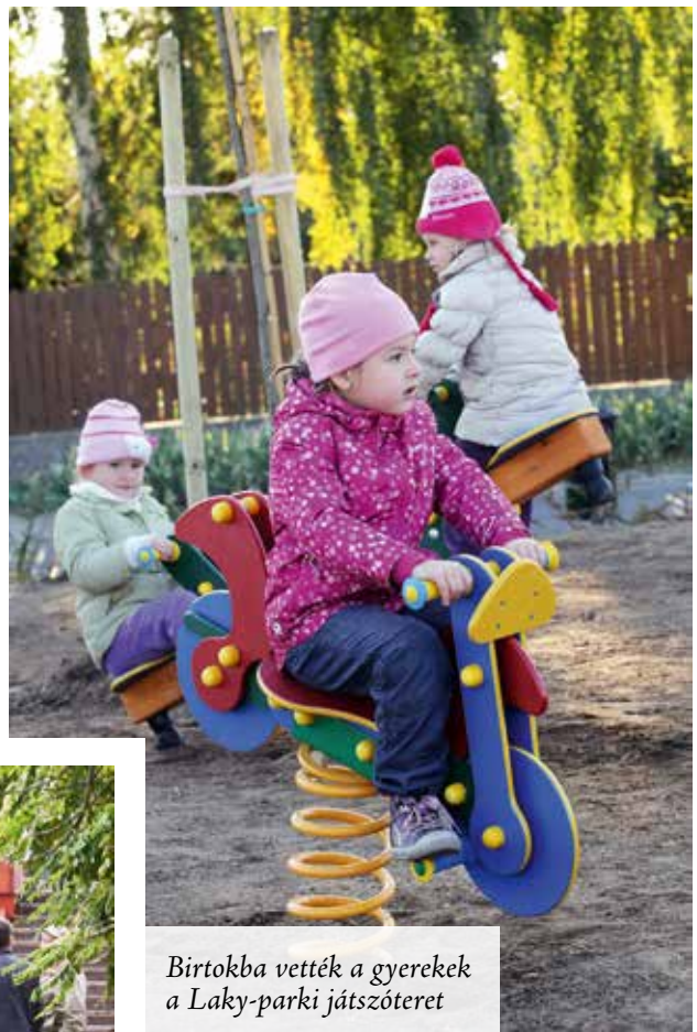
Birtokba vették a gyerekek a Laky-parki játszótér