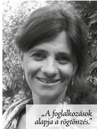
„A foglalkozások alapja a rögtönzés.”