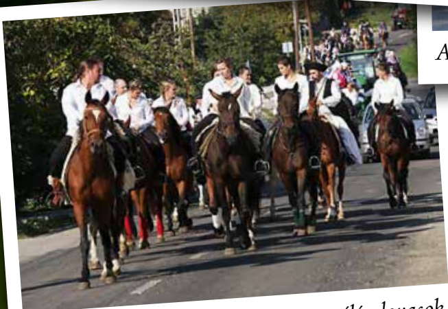
A menet élén lovasok.