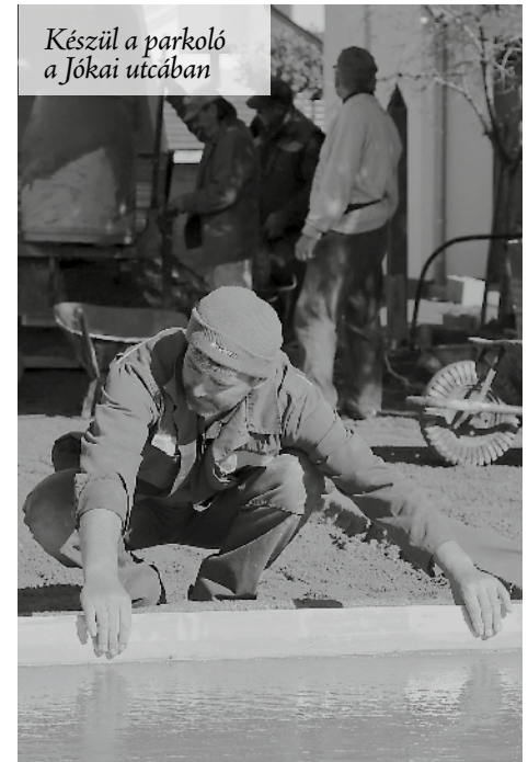
Készül a parkoló a Jókai utcában

A falu két forgalmas útjának, a Jókai utcának és a Béke térnek a felújítása, átépítése kezdődött meg októberben.