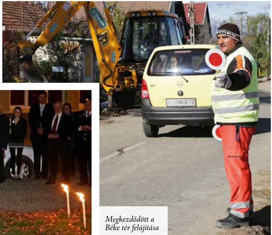
Megkezdődött a Béke tér felújítása