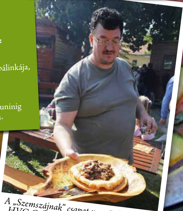
A „Szemszájnak” csapat vezetőjében az idej HVG Goldenblog Pop Art kategóriájának közönségdíjas bloggerét tisztelhetjük, aki feleségével /a „Mézeskalács faloda” csapatának tagja/ azért alkotott két csapatot, mert csak így tudták megvalósítani az összes felmerült ötletet. Ki-ki kedvére eldöntheti, hogy a hegyi rabló tokány vagy a rég elfeledett savanyú vetrece áll közelebb szívéhez.