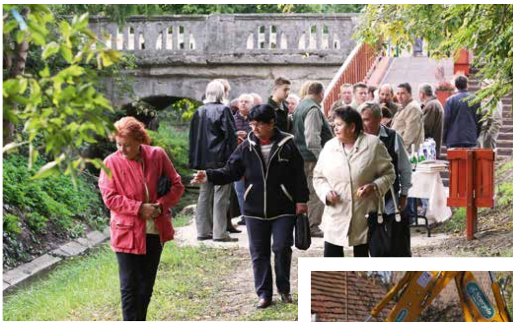
A lépcső megépítésével a pataksétányon a faluközpontból egészen a Bulgárkertig végigsétálhatunk