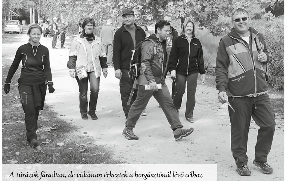
A túrázók fáradtan, de vidáman érkeztek a horgásztónál lévő célhoz

A dolog másik különlegessége, hogy maga a díj (külsőleg) nem kapcsolódik a kézilabdához, az minden esetben egy műalkotás, mely jellemzően falra akasztható, tehát a lakás díszé lehet. FÁBIÁN PÁL szerint ennek két oka van: „Egyrészt minden sportolónak, aki legalább a közepes szintig eljutott, valószínűleg sok érme és ereklyéje van, ezeket azonban nem nagyon teszik ki a lakásba, általában egy fiókban végzik. Másrészt pedig a Fábrián Ferenc-díj nem csak egy embernek szól, hanem annak a feleségnek, élettársnak is, aki a díjazottnak lehetővé teszi, sőt, támogatja, hogy szinte minden idejét feláldozva a kézilabdásainkkal foglalkozhasson.”