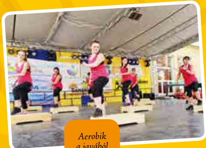
Aerobik a javából