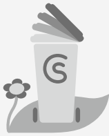
Csömöri Települési Szolgáltató Nonprofit Kft.

Egy hónap múlva, július végén indul a zöldhulladék begyűjtése. Az önkormányzat a Csömöri Települési Szolgáltató Nonprofit Kft.-vel nyár közepétől a zöldhulladékok begyűjtésére is megoldással szolgál.