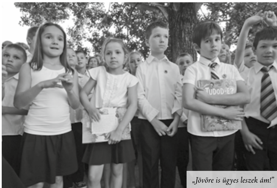
„Jövőre is ügyes leszek ám!”