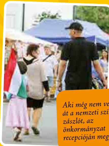
Aki még nem vette át a nemzeti színű zászlót, az önkormányzat recepcióján megteheti

Az önkormányzat a falunapokon indította el szimbolikus akcióját, melynek célja, hogy nemzeti ünnepeinken községünkben ne csupán az utcák, terek, közintézmények, hanem a lakóházak is fel legyenek lobogóva. Az akcióban minden csömöri ingatlanra egy zászlót, konzolt és rudat ad az önkormányzat díjmentesen.