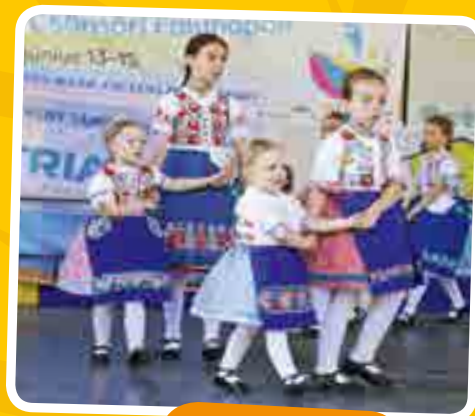
A Furmicska legkisebbjei