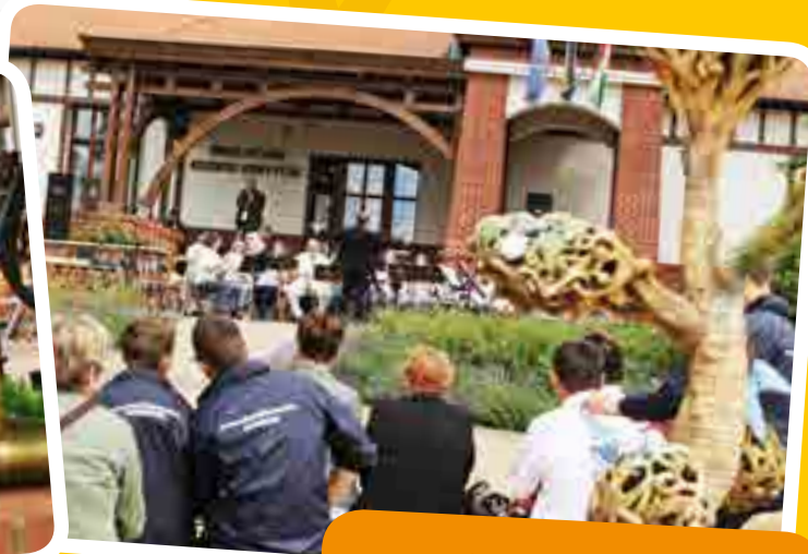
... és a közönség szemszögéből...

Június idén a fesztiválok hava volt Csömörön, négy nagy rendezvény is várta a látogatókat.