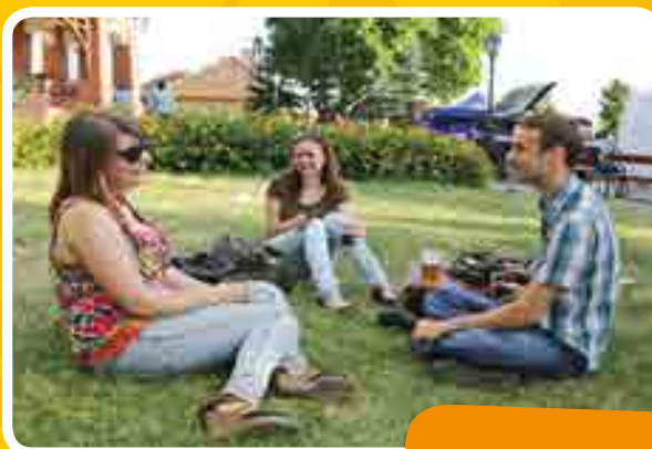
Pihennek a fesztiválózóknak