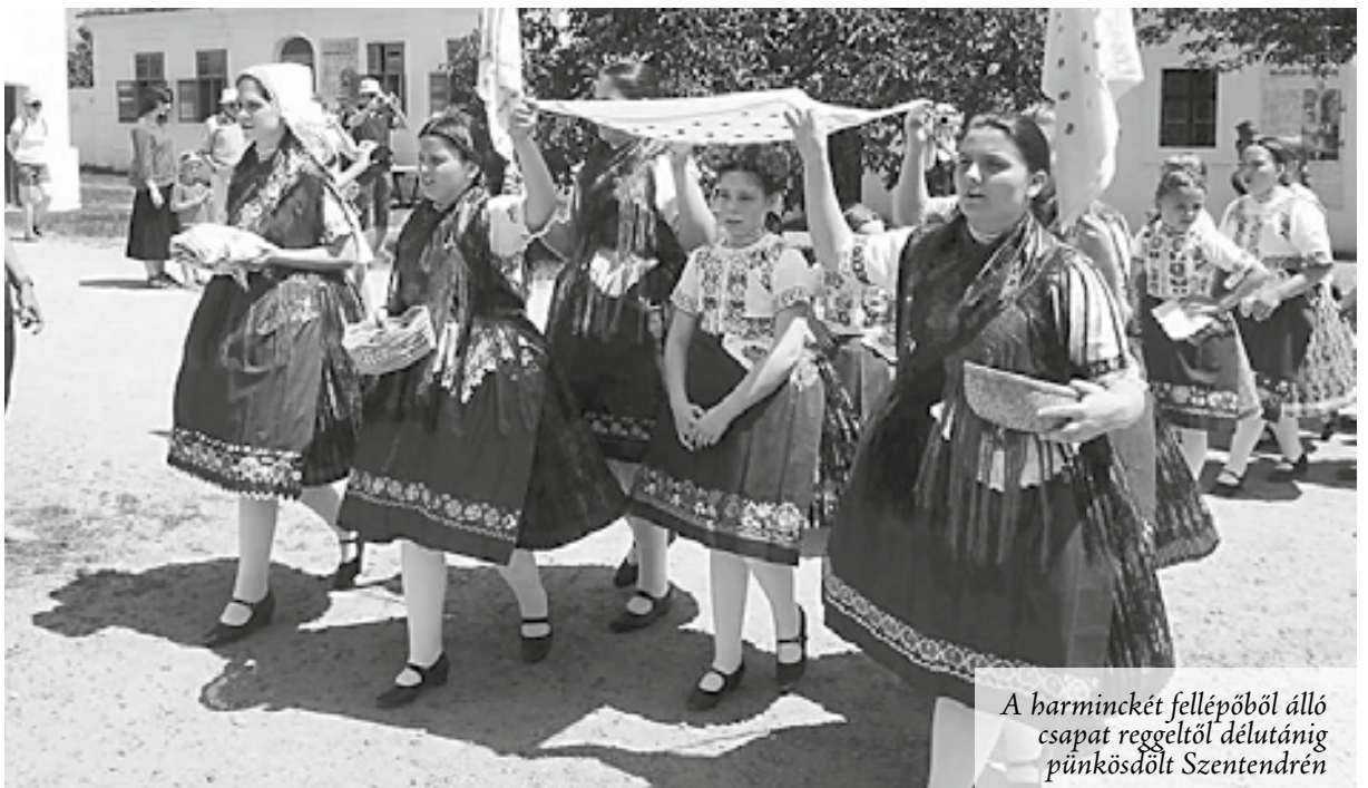
A harminckét fellépőből álló csapat reggeltől délutánig pütkösölt Szentendren