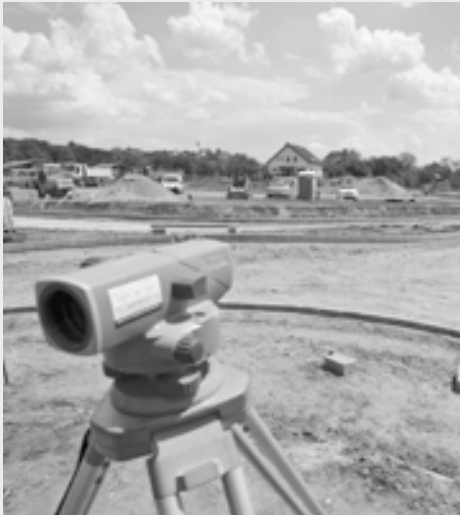
Hamarosan megnyílik a 3-as bekötőút