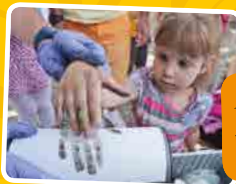
A rendőrség standján ujjlenyomatot vettek. Persze, csak a játék kedvéért