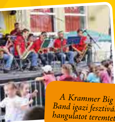
A Krammer Big Band igazi fesztivál- hangulatot teremtett