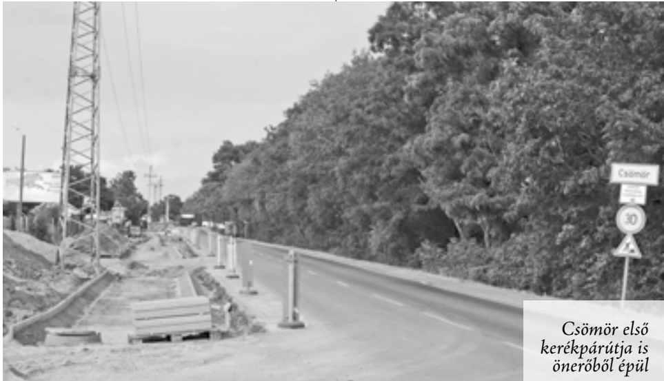
Csömör első kerékpárútja is önerőből épül