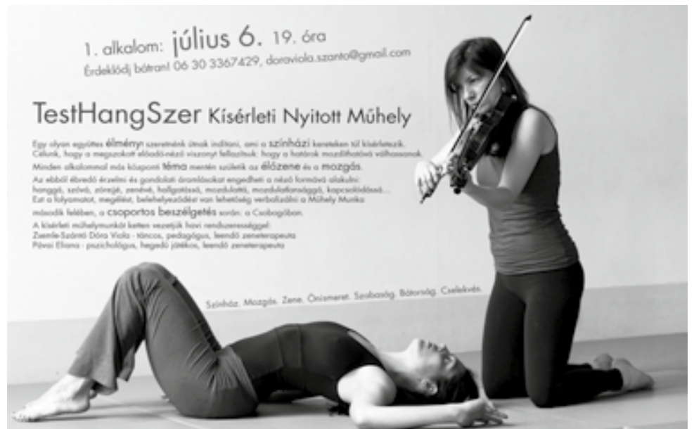
Az oldalt összeállította Bujdosó B. Kriszta

Júliusban kísérleti nyitott műhely indul a Csömöri Sportcsarnokban: