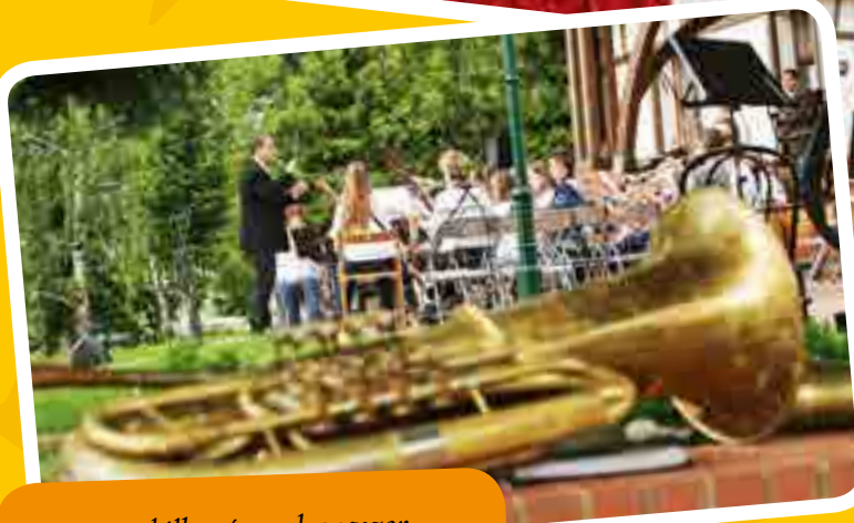
Fúvóstalálkozó egy hangszer ...