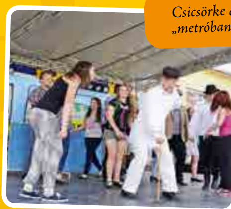
Csicsörke a „metróban”