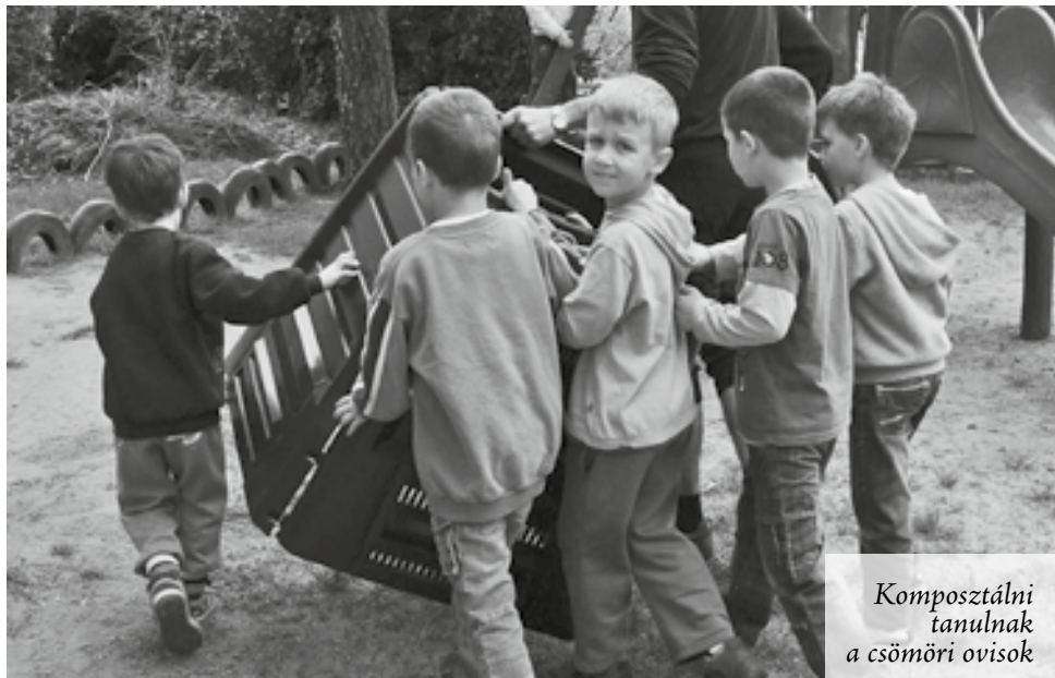
Komposztálni tanulnak a csömöri ovisok

Az az 52 család, amelyik tavaly jelentkezett a házi komposztálási programra, értesülhetett arról, hogy a településen az EGT/ Norvég Civil Támogatási Alap jóvoltából egy környezetvédelmi program zajlik. Azóta további családok, több mint száz újabb jelentkező csatlakozott a programhoz. Ők remélhetőleg a képviselő-testület jóvoltából juthatnak a