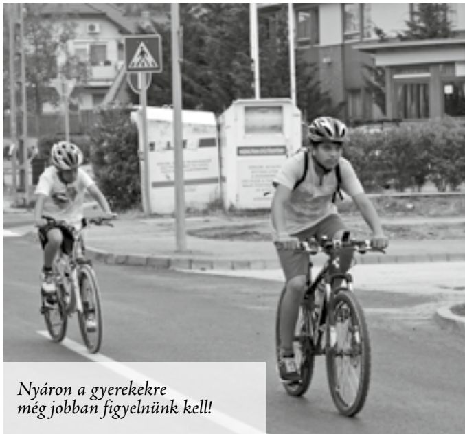
Nyáron a gyerekekre még jobban figyelniünk kell!