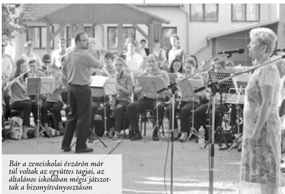
Bár a zeneiskolai évvárón már túl voltak az együttes tagjai, az általános iskolában mégis játszottak a bizonyítványosztáson