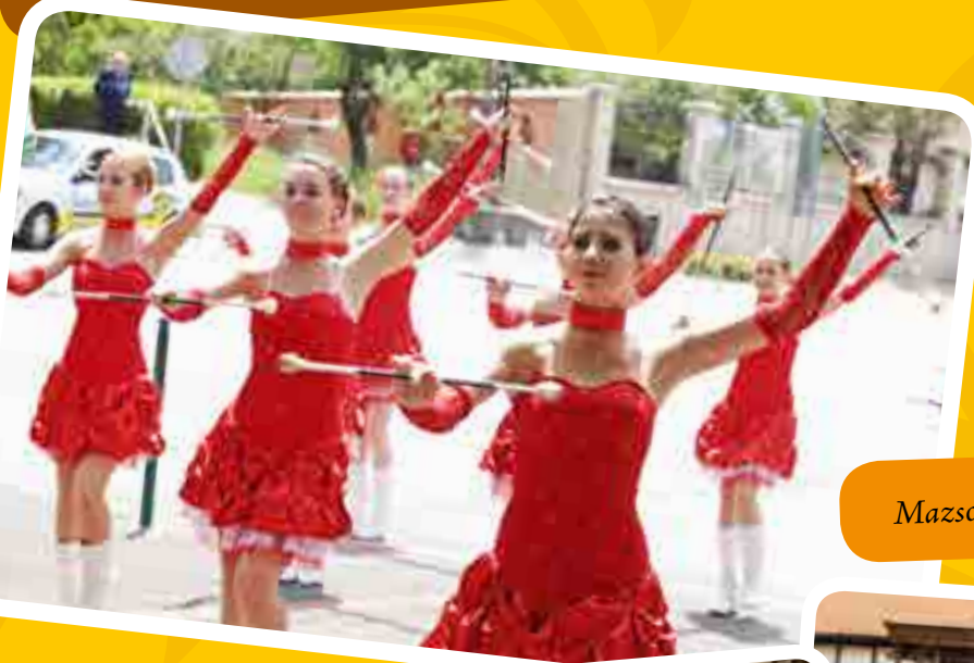
Mazsorettek csábították a közönséget

Június 1-jén a Hősök terén rendezték meg a III. Csömöri Fúvóstalálkozót. A Kramer Teréz Zeneiskola szervezésében létrehozott fesztiválon a Csömöri Ifjúsági Fúvózenekar mellett felléptek a Színhalmi fúvósok és mazsorettek, az Ossó János Fúvós Zenekar, a Kamp János Kapelle, a Simándy József Általános Iskola fúvózenekara, és az Erkel Gyula Újpesti Ifjúsági Fúvózenekar. A délutáni programot délelőtt a falu több pontján megjelenő fúvósok és mazsorettek előadásával harangozták be, akik a Hősök terén, a Laky saroknál, a Béke téren és a Szabadság úton invitálták a közönséget.