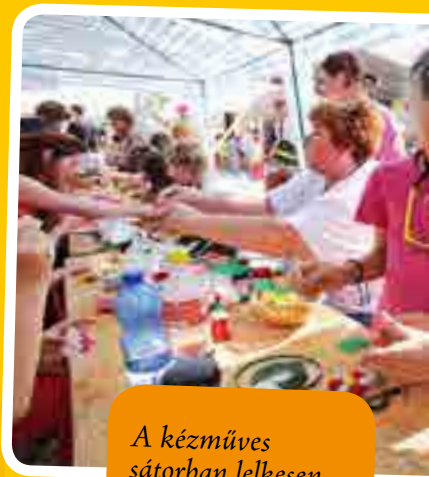
A kézműves sátorban lelkesen alkottak a gyerekek