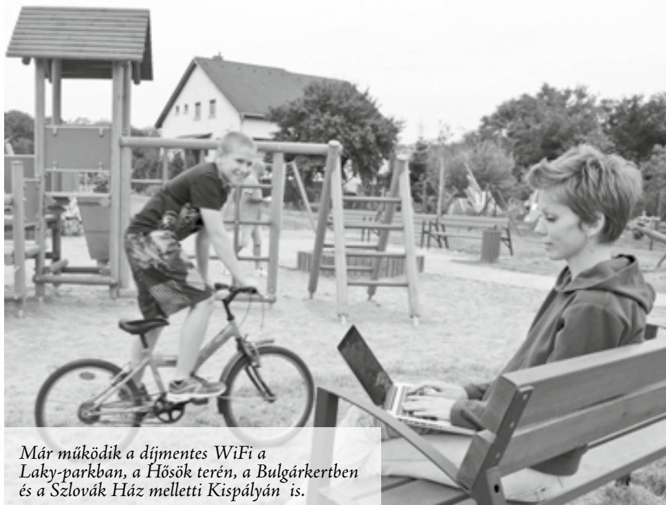
Már működik a díjmentes WiFi a Laky-parkban, a Hősök terén, a Bulgárkertben és a Szlovák Ház melletti Kispályán is.

A fontossági sorrend felállításakor mindketten egyetértettek abban, hogy mindennek elé tehető a közösség meghatározó ereje. A legfontosabb megteremteni a lehetőséget arra, hogy a közösségi lét megvalósuljon, és minőségi szabadidős tevékenységgé nője ki magát az egészség és környezettudatosság jegyében. Ezért épülnek és szépülnek a parkok és terek, és ezt a célt szolgálják azok a folyamatban levő vagy tervezés alatt álló projektek, amelyek ha elkészülnek, arra buzdítják a fiatalokat, hogy bátran mozduljanak ki otthonról. Erre nagyon jó példa a még befejezésre váró Béke tér felújítása, ahova pingpongasztalt, kültéri sakkasztalt telepítenek majd. A település vezetése egyenesen azt gondolja, hogy fel kell venni a fiatalok ritmusát, és az igényeikhez kell igazítani a lehetőségeket. Éppen ezért kezdeményezték és vitték sikerre a legnépszerűbb köztereken a díjmentes WiFi-szolgáltatás bevezetését. A Laky-parkban, a Hősök terén, a Bulgárkertben és a Szlovák Ház melletti Kispályán már működik