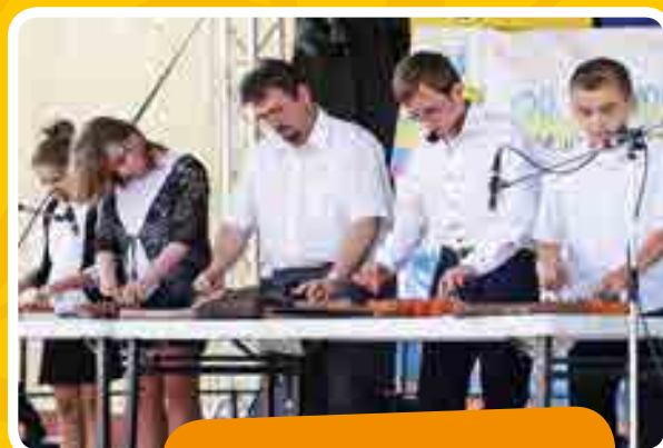
Sokan hallgatták a torockói citerazenekar előadását