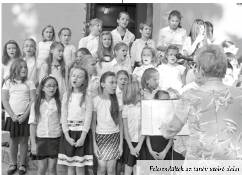
Felcsendültek az tanév utolsó dalai