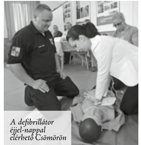
A defibrillátor éjjel-nappal elérhető Csömörön

Májusban rendőrségi és tűzoltósági vezetők, valamint a helyi közbiztonsági szereplők részvételével tartottak fórumot Csömörön a művelődési házban.