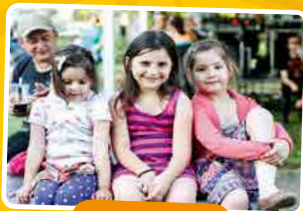
„Mi most az Alma együttésre várunk...”