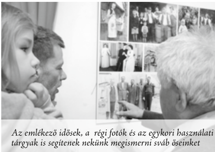
Az emlékező idősek, a régi fotók és az egykori használati tárgyak is segítenek nekünk megismerni sváb őseinket