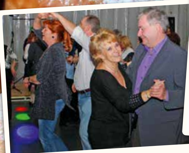
Hajnalig tartott a mulatság a sportbálon