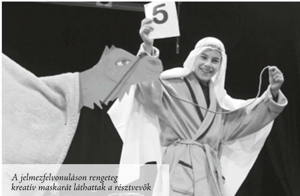
A jelmezfelvonuláson rengeteg kreatív maskarát láthattak a résztvevők