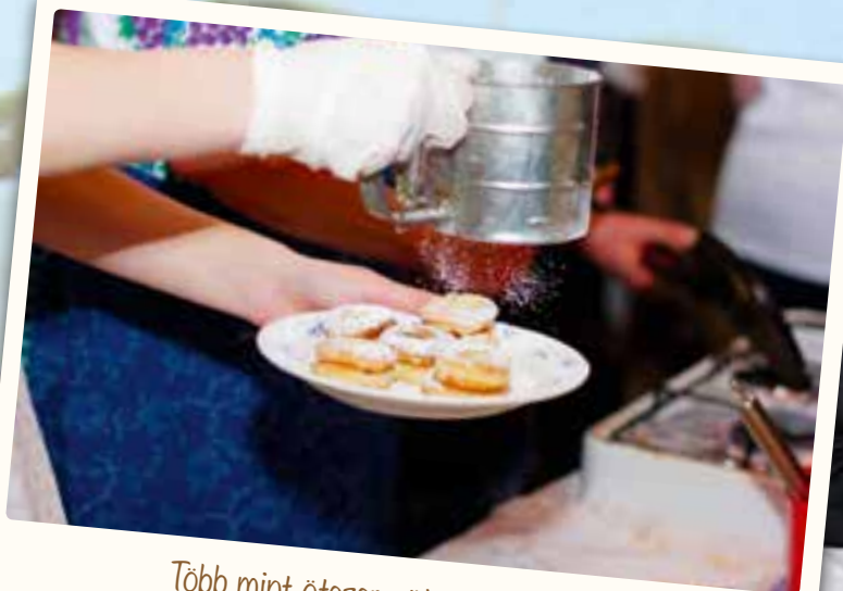
Több mint ötezer sütemény fogyott el a Hájastészta- és fánk sütő versenyen