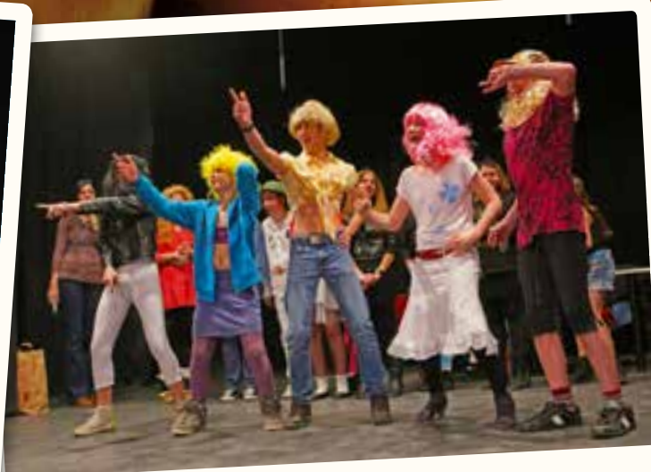
A felső tagozatos farsang igazi „kamaszbuli” volt