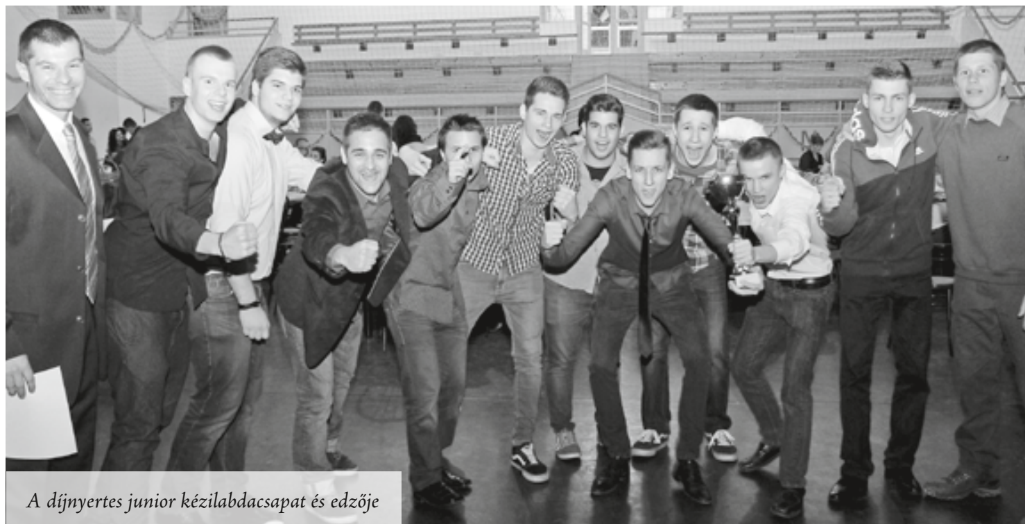
A díjnyertes junior kézilabdacsapat és edzője