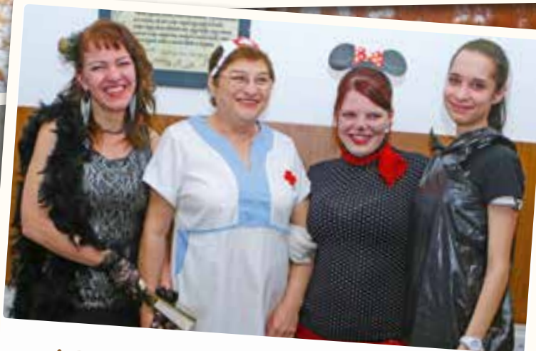
A Turnovszky István Kertbarát Kör farsangi bálján ismét ötletes jelmezekben mulattak a vendégek