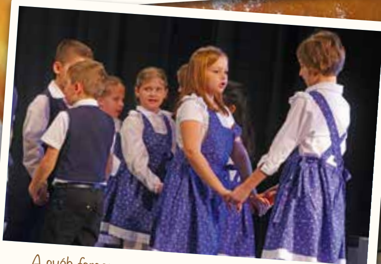
A sváb farsangon az új formaruhákban fellépő kicsik tánccal és dramatizált mesével lepték meg a közönséget