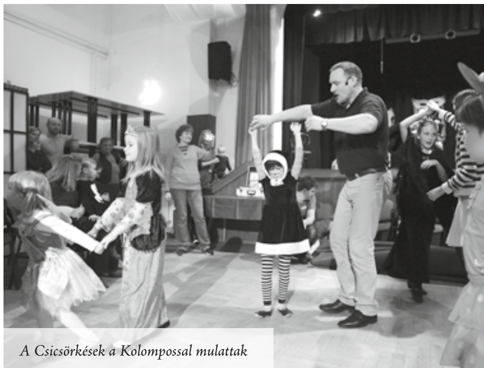
A Csicsörkések a Kolompossal mulattak

Nem, határozottan nem, mindent ugyanígy csinálnék, ha újra kezdhetném. Volt két feleségem, született két gyönyörű lányom, és van két lányunokám. Úgy tűnik, nálunk a lányok viszik tovább a vérvona-