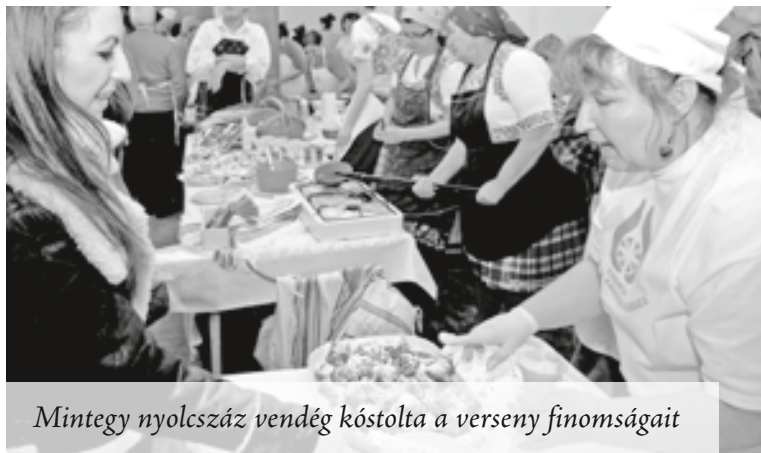
Mintegy nyolcszáz vendég kóstolta a verseny finomságait

A tizenhatodik alkalommal megrendezett esemény népszerűbb volt, mint valaha: több mint ötezer darab fánk fogyott el. A helyszínen kilenc csoport sürgött-forgott, voltak, akik komoly háttér munkával készültek, telefonon jelezték, ha fogyóban volt a tészta, és már érkezett is a begyúrt utánpótlás. Összesen 30-30 versenyző állt a startvonalhoz, azaz a tűzhelyek mellé hájas tészta, fánk és lekvár kategóriában, a nyolcszáz látogató legnagyobb öröme. A korábbi szervezési tapasztalatokból tanulva zökkenőmentesen zajlott a jegyek osztása, és némi jó szerencsének is köszönhetően a finom falatok kitartottak a rendezvény végéig, akkorra viszont el is fogyott az utolsó fánk is. A gasztronómiai élmény mellett szemünk-fülünk is élvezhette a jó hangulatot, a Csicsörke, Furmicska és a kerepesi táncsoport, a Báló Lipót Népdalkör és standard táncosok műsorának köszönhetően.