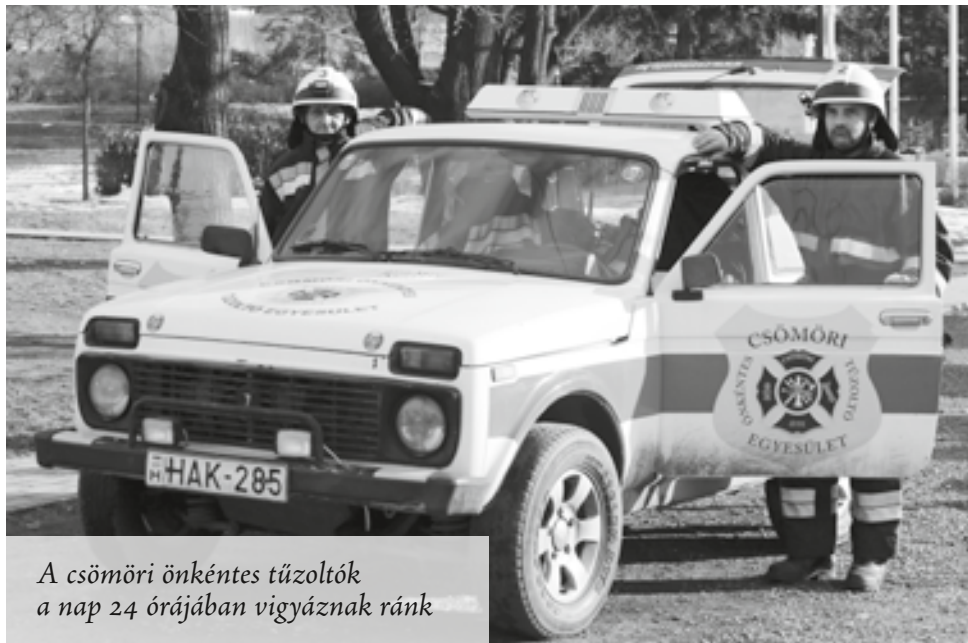
A csömöri önkéntes tűzoltók a nap 24 órájában vigyáznak ránk

A Csömöri Önkéntes Tűzoltó Egyesület közvetlen telefonszáma, mely viharok, fákidőlés, balesetek, bajba került állatok esetén hívható: