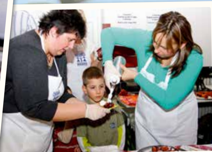
A gyerekek nagy kedvencévé vált a csokis fánk