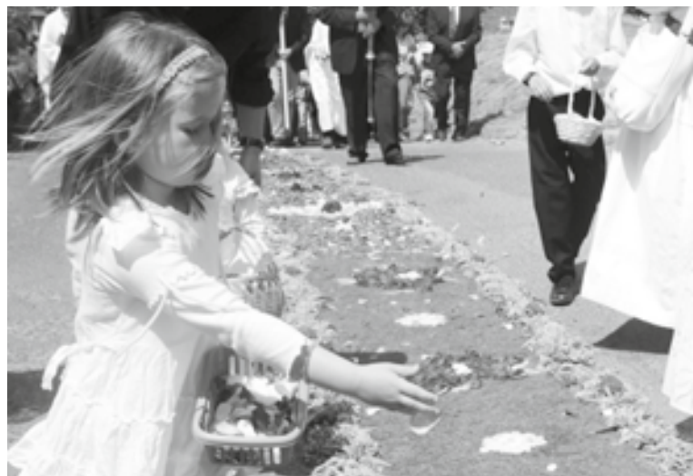
Az úrnapi körmenet egy olyan csodálatos esemény, amely méltó lenne rá, hogy hungarikummá váljon

A hungarikumtörvény nyolc kategóriát határoz meg, ami rendkívül sokrétű. Ide tartoznak például az agrártermékek, egyedi növény- és állatfajták, élelmiszer-ipari termékek. Nálunk is teremnek hasonlóak, például a híres csömöri paradicsom, vagy a svábok különleges őszibarackfajtája. Az épített környezet vonatkozásában