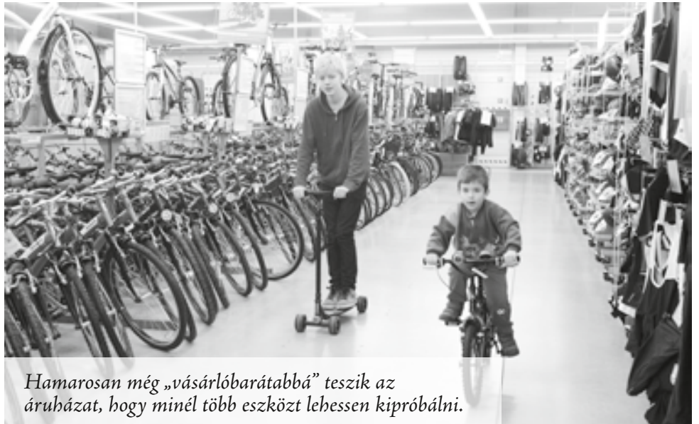
Hamamosan még „vásárlóbarátabbá” teszik az áruházat, hogy minél több eszközt lehessen kipróbálni.

Kilenc éve csatlakoztam a Decathlon csapatához eladóként, nyári gyakorlatra. Magával ragadtak a vállalat számára fontos értékek, mint a csapatszellem, vitalitás, felelősségtudat, s nyár végére tudtam, hogy ide szeretnék tartozni. Három évig voltam eladó, közben informatika szakot végeztem, és a Kecskeméten nyíló áruházban már részlegvezetőként folytattam a munkát. Lelkesítő volt részt venni egy új áruház születésénél. Később volt szerencsém a nyíregyházi nyitáznál is jelen lenni, oda már igazgatóként érkeztem, gyakorlatilag a munkafolyamatok minden fázisába betekintheztem.