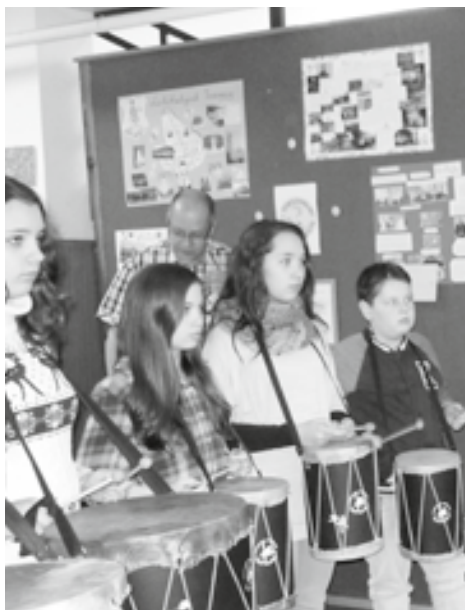
A történelemversenyen második helyezett lett a csömöri csapat

Egyéves szünet után az idén végre megrendeztük a 2. Történelmi Tusát. Február 28-án, a történelmi csapatversenyen a környező települések általános iskolái vettek részt: Kistarcsa, Isaszeg, Pécel és Gödöllő képviseltette magát.