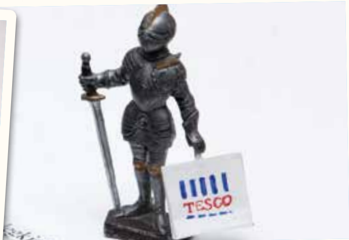
A legkisebb is számít...