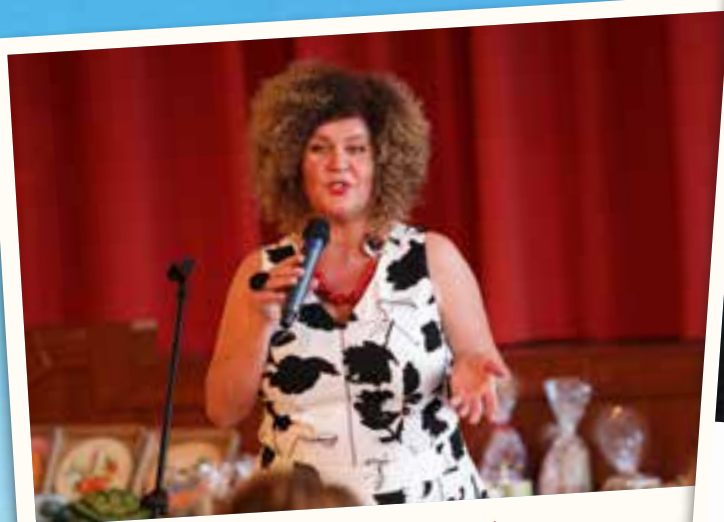
Soma öngyógyításról tartott előadására nagyon sokan voltak kíváncsiak