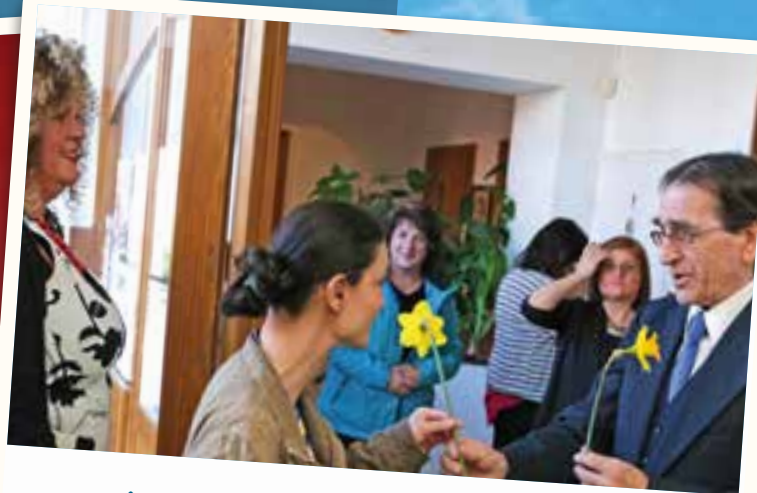
A nőnap alkalmából minden hölgyvendégnek virággal kedveskedtek a művelődési házban