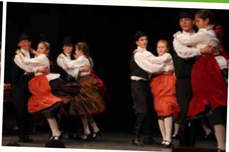
Nagy siker mellett mutatták be tudásukat a csicsörkés csoportok