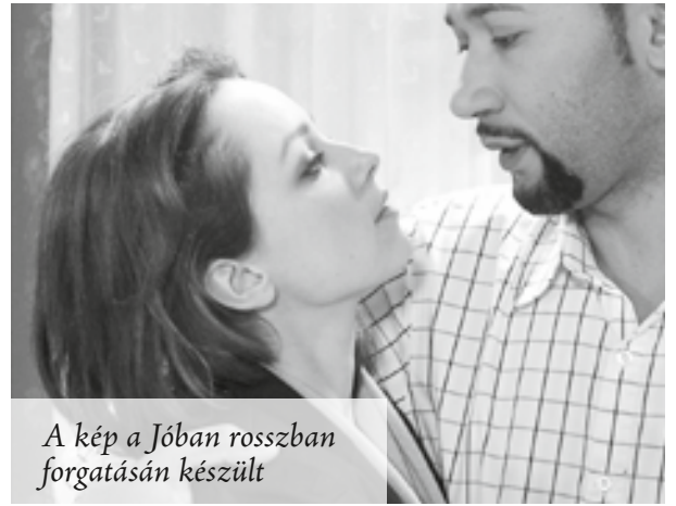
A kép a Jóban rosszban forgatásán készült