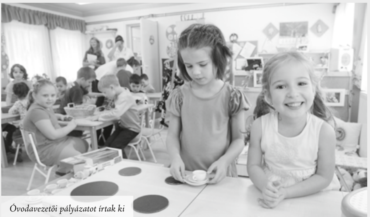
Óvodavezetői pályázatot írtak ki