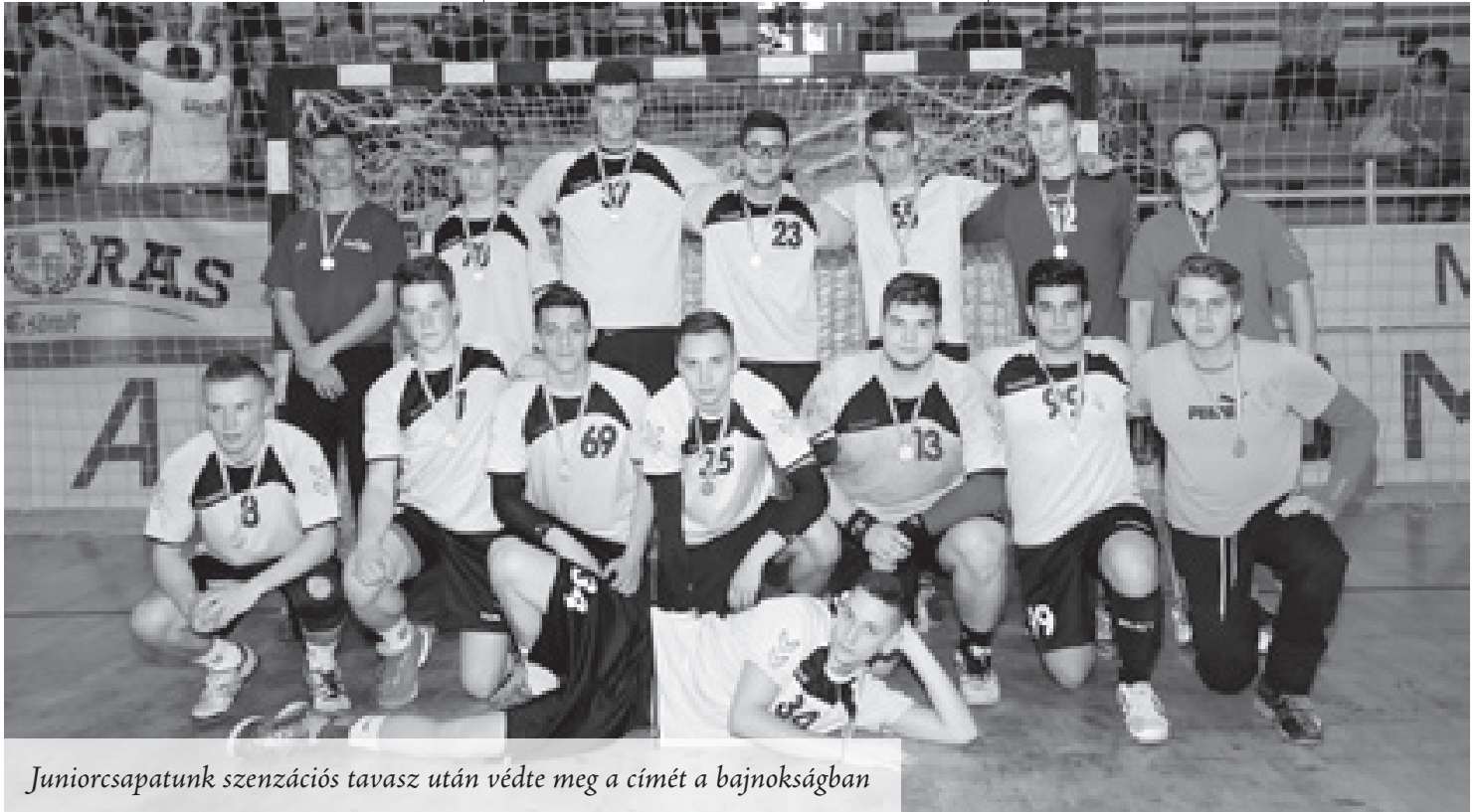
Juniorcsapatunk szenzációs tavasz után védte meg a címét a bajnokságban