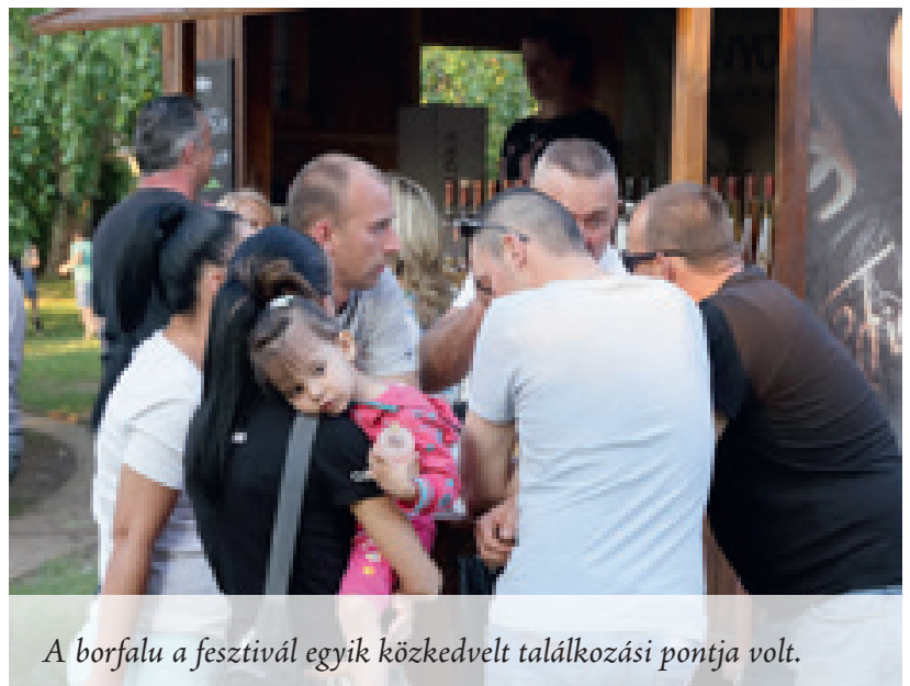
A borfalu a fesztivál egyik közkedvelt találkozási pontja volt.