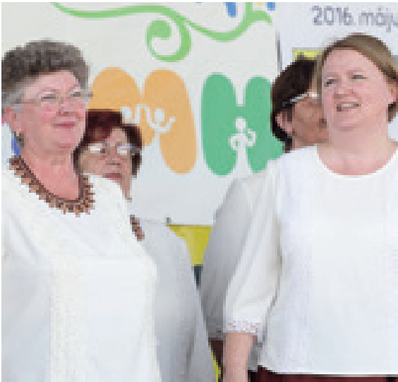
A helyi csoportok fellépését, többi között a Furmicska rendhagyó előadását, a Csicsörke és a Tiszta Forrás Népdalkör műsorát is nagy siker övezte.