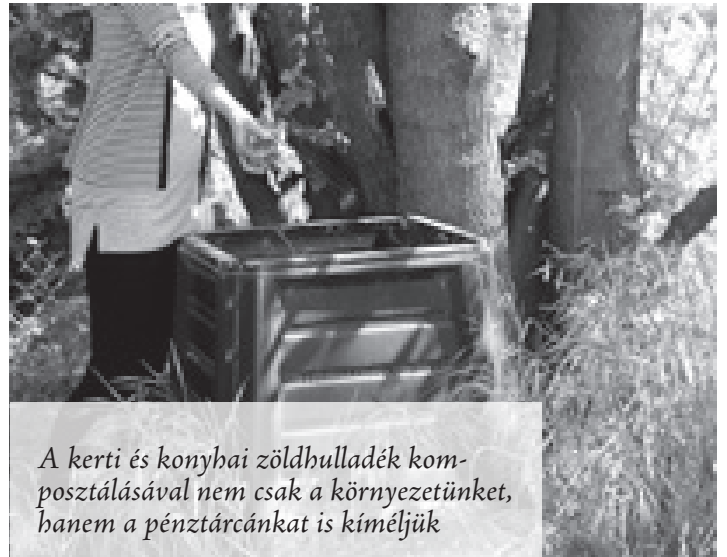
A kerti és konyhai zöldhulladék komposztálásával nem csak a környezetünket, hanem a pénztárcánkat is kíméljük

Mivel a növények a talaj ásványi anyagából, vízből és napfényből nőnek, maradványukat a földbe kell visszajuttatni, mert az onnan vétetett, onnan hiányzik. A gyermekek erre fogékonyak, és rajtuk keresztül talán a szüleik is azzá tehetők. A komposztálással évtizedek óta foglalkozó szomszéd kerületi SZIKE Egyesület is partnerünk az ismeretterjesztő előadások, képzések megtartásában. Így