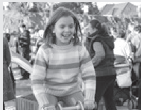
Hamarosan az Árpád utcában is megépül a játszótér

A testület egyhangúlag támogatta az érdekeltség-növelő pályázaton való indulást összesen 4.206.000 Ft összegű saját erővel.