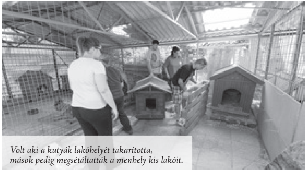
Volt aki a kutyák lakóhelyét takarította, mások pedig megsétáltatták a menhely kis lakóit.