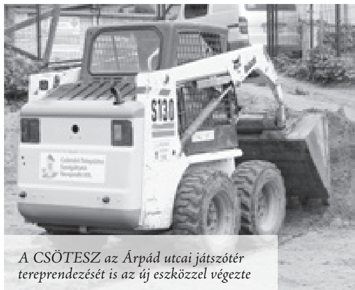
A CSÖTESZ az Árpád utcai játszótér tereprendezését is az új eszközzel végezte