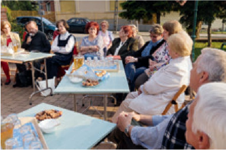
Az idei programsorozat első napján irodalmi kávéházat tartottak a könyvtár előtt.