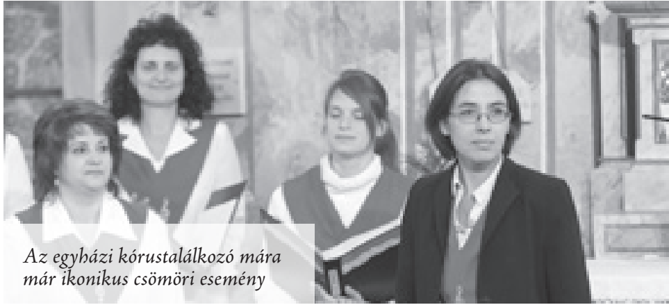
Az egyházi kórustalálkozó mára már ikonikus csömöri esemény