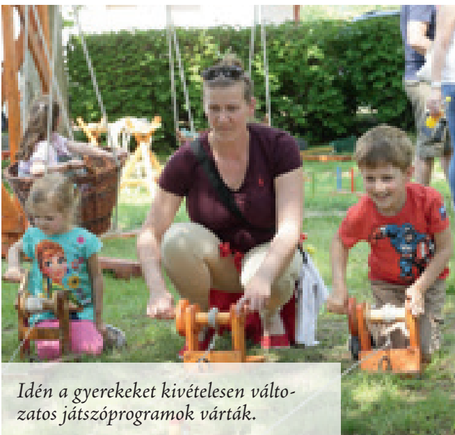
Idén a gyerekeket kivételesen változatos játszóprogramok várták.