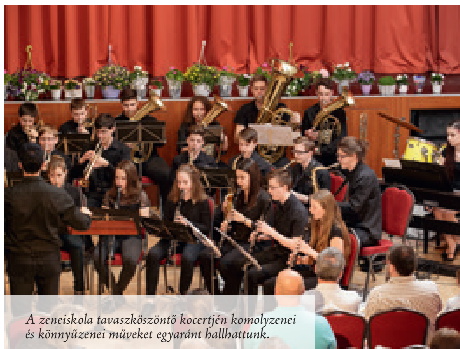
A zeneiskola tavaszköszöntő kocertjén komolyzenei és könnyűzenei műveket egyaránt hallhattunk.