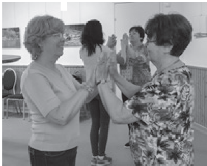
A tánc a leghatékonyabb mozgásforma a demencia megelőzésére, és 76%-ban segít megelőzni az Alzheimer-kórt.

A szenior örömtánc hétfőnként 13.30-15.00 óráig tart a művelődési házban. A résztvevőknek kényelmes cipőre van szüksége. Bejelentkezni nem szükséges. A részvétel 800 Ft/alkalom vagy 3500 Ft/ 5 alkalom.