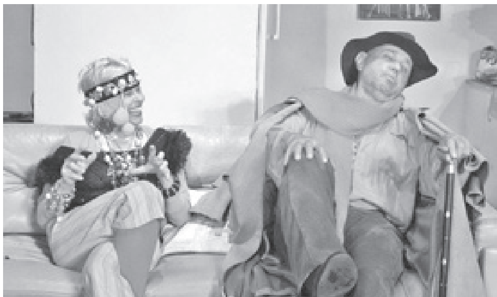
A fergetegetes komédia 100. előadását láthatja a csömöri közönség májusban.

Andrew Bergman a 80'-as évek máig érvényes valóságát írta meg kellemesen szórakoztatóan, kacagásba bújtatva. Talán kicsit amerikai magatartásnak nevezném azt az egyébként manapság mindenhol jellemző viselkedést, amikor kicsit többet, jobbat mutatunk annál, ami a valóság. A Társasjátékban két öregember fitte szereti magát, bizonyítva, hogy a szerelem