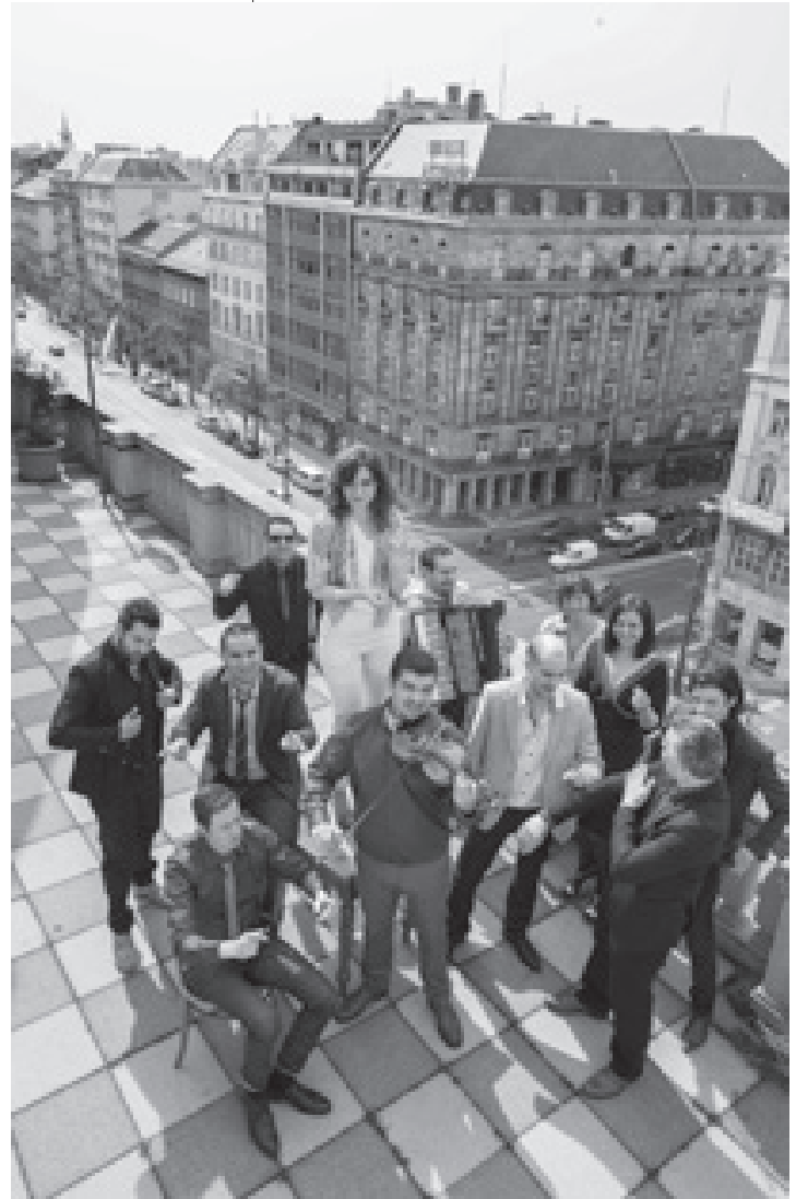
Május 26-án Csömörön koncertezik a Budapest Bár.