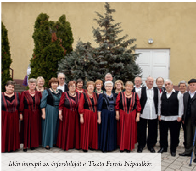
Idén ünnepli 10. évfordulóját a Tiszta Forrás Népdalkör.