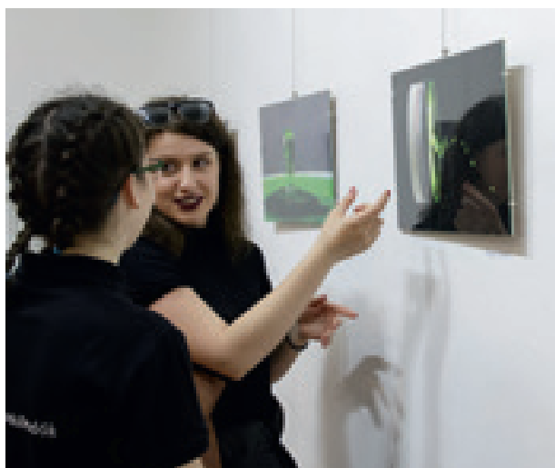
A Képpen gondolkodók klubja kiállításán a csobbanó, loccsanó élményé volt a főszerep.