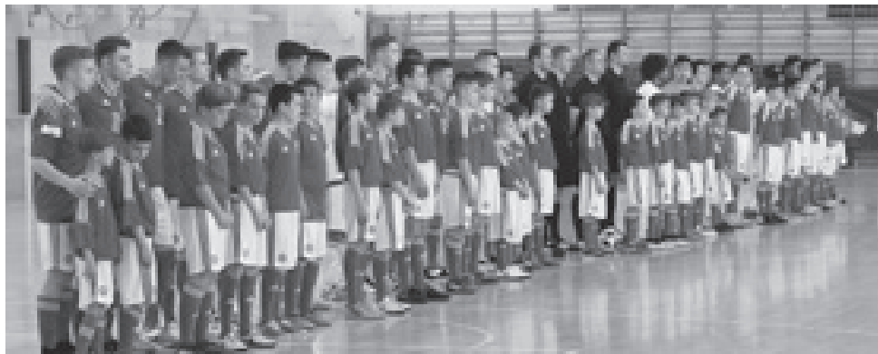
Világklasszisok ellen szerepelt Csömörön az U18-as magyar futsalválogatott!

Magyar Kerékpársport Önkormányzat Alapítvány Adószám: 18504341.1