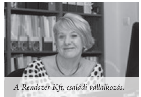
A Rendszer Kft. családi vállalkozás.

A 2008-ban hirtelen bekövetkezett gazdasági válság minket sem kímélt. Sorra zártak be üzletek, szüntek meg vállalkozások, újjak pedig nem indultak. Olyan ügyfelek voltak kénytelenek befejezni tevékenységüket, akikről azt hittük, nyugdíjukig partnerek maradunk. Nagyon nehéz időszak volt, szó szerint a túlélésre játszottunk, sok könyvelőiroda bezárt. Nem volt könnyű ez a négy-öt év, annak