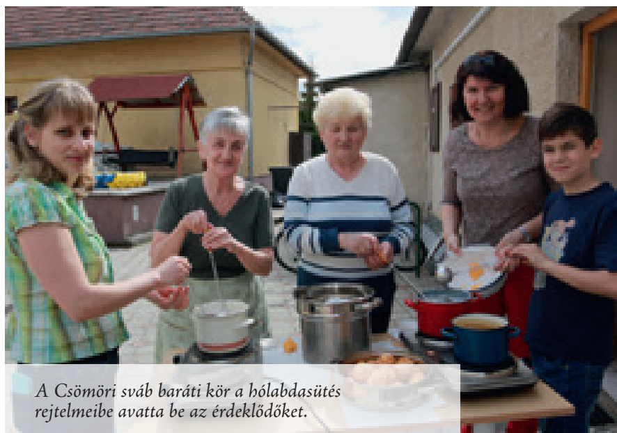
A Csömöri sváb baráti kör a hólabdasütés rejtelseibe avatta be az érdeklődőket.