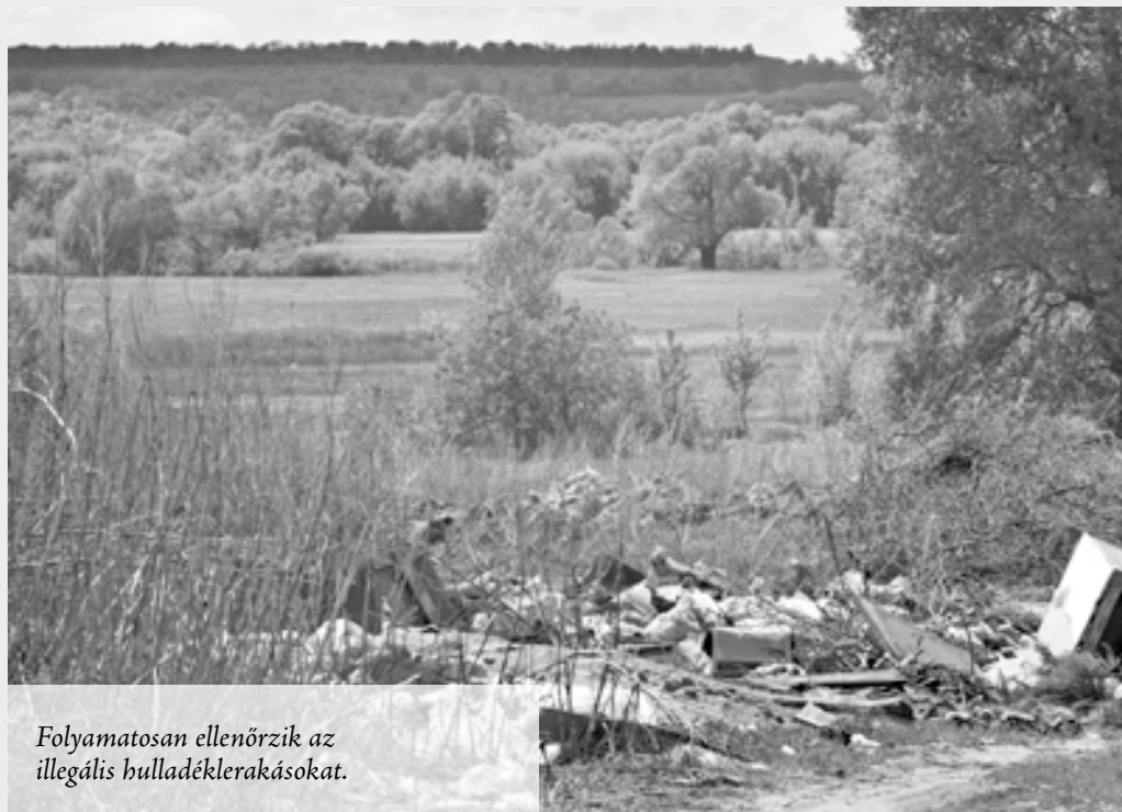
Folyamatosan ellenőrzik az illegális hulladéklerakásokat.