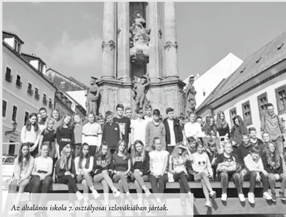
Az általános iskola 7. osztályosai szlovákiában jártak.