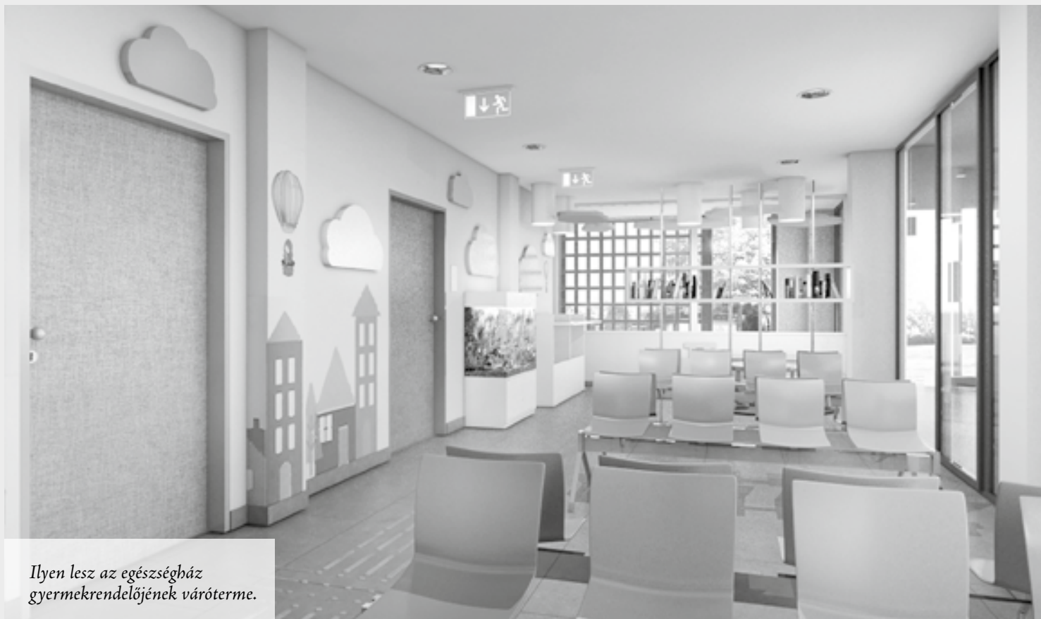
Ilyen lesz az egészségház gyermekrendelőjének váróterme.

vetően egy darab műanyag komposztáló tartály megvásárlása esetén kettő darab 340 literes komposztáló edényt vehetnek át.