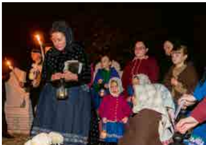
Mindenszentek alkalmából, november 1-jén idén is útnak indultak fáklyák, lámpások és énekek kíséretében a tót hagyományörzők, hogy tiszteletüket tegyék a csömöri temetőben.