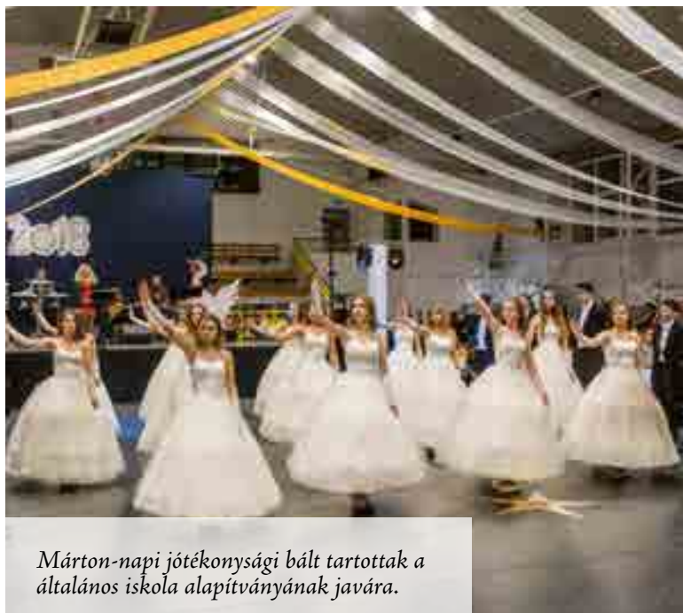
Márton-napi jótékonysági bált tartottak a általános iskola alapítványának javára.