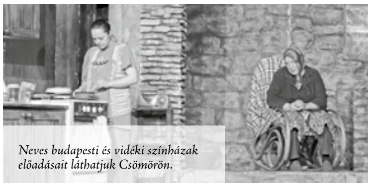
Neves budapesti és vidéki színházak előadásait láthatjuk Csömörön.