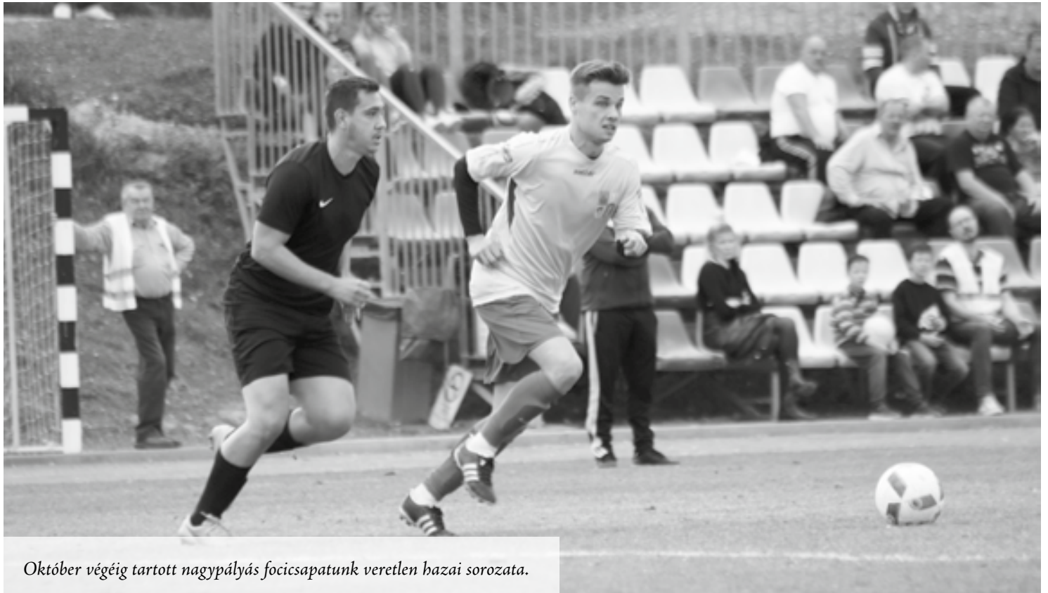
Október végéig tartott nagypályás focicsapatunk veretlen hazai sorozata.