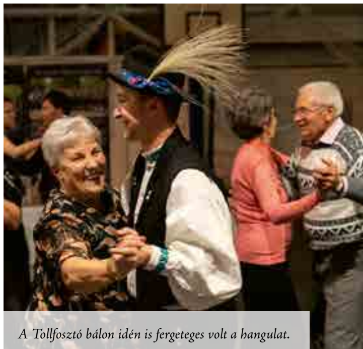
A Tollfosztó bálon idén is fergetes volt a hangulat.