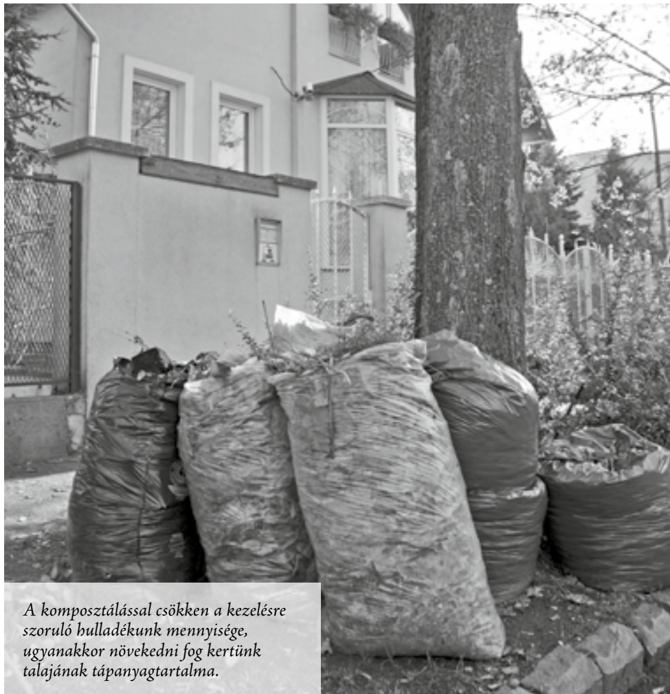
A komposztálással csökken a kezelésre szoruló hulladékunk mennyisége, ugyanakkor növekedni fog kertünk talajának tápanyagtartalma.

Amikor a csömöri önkormányzat komposztálókat ad a lakosságnak, több célt kíván elérni. A kerti komposztálás során a konyhában és a kertben keletkező szerves anyagok egy természetes folyamat során