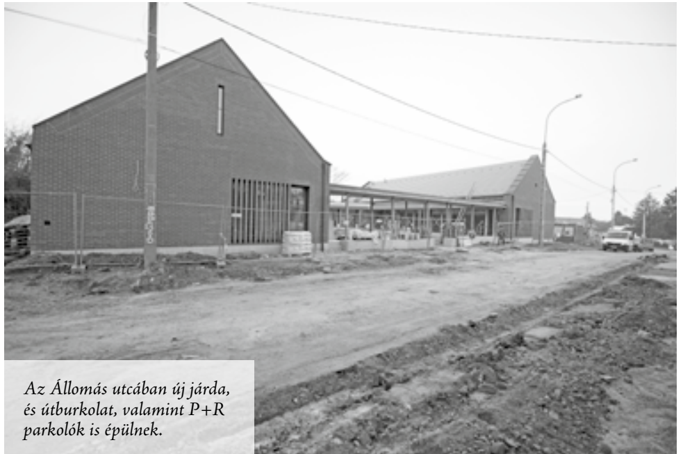
Az Állomás utcában új járda, és útburkolat, valamint P+R parkolók is épülnek.

A 2017-2021-ig tartó Közösségi tér- és Közterület-fejlesztési Programunk fontos elemei a rekreációs fejlesztések, amelyek nem más takarnak, mint a nagyközség kivételes adottságokkal rendelkező területeinek közösségi célú kialakítását, fejlesztését, amellyel hozzá tudunk járulni ahhoz, hogy az itt élők helyben is megtalálják a kiránduláshoz, a szabadban eltöltött programokhoz megfelelő helyszíneket. Jelenleg is zajlik a horgászto mellett szabadidőpark fejlesztése, ahol a játszótér felújítása mellett felnőtt kondiparkot is létrehozunk, benne mozgó eszközökkel. Emellett nyilvános mosdót, WC-t építettünk, és közvilágítást alakítottunk ki, felújítjuk a patakhidat. Idén mutattuk be az érdeklődőknek a csömöri körtúra nyomvonalán elhelyezkedő régi