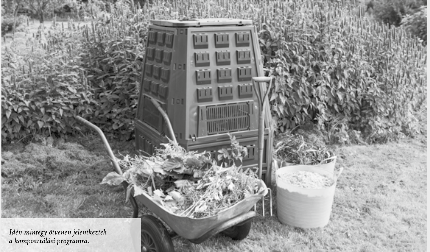
Idén mintegy ötvenen jelentkeztek a komposztálási programra.

szabadtéri sportközpont bővítését célzó pályázathoz az önkormányzatnak tulajdonosi nyilatkozatot kell tenni, és ezt hiánypótlásként benyújtani. A képviselők egyhangúlag megszavazták a tulajdonosi nyilatkozat benyújtását.