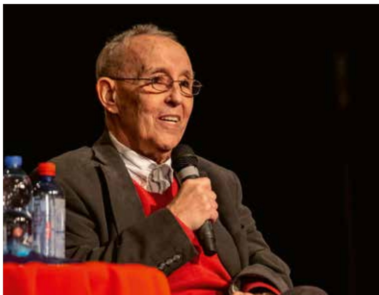
Vekerdy Tamás gyermekpszichológus a kamaszkorról tartott előadást a művelődési házban.