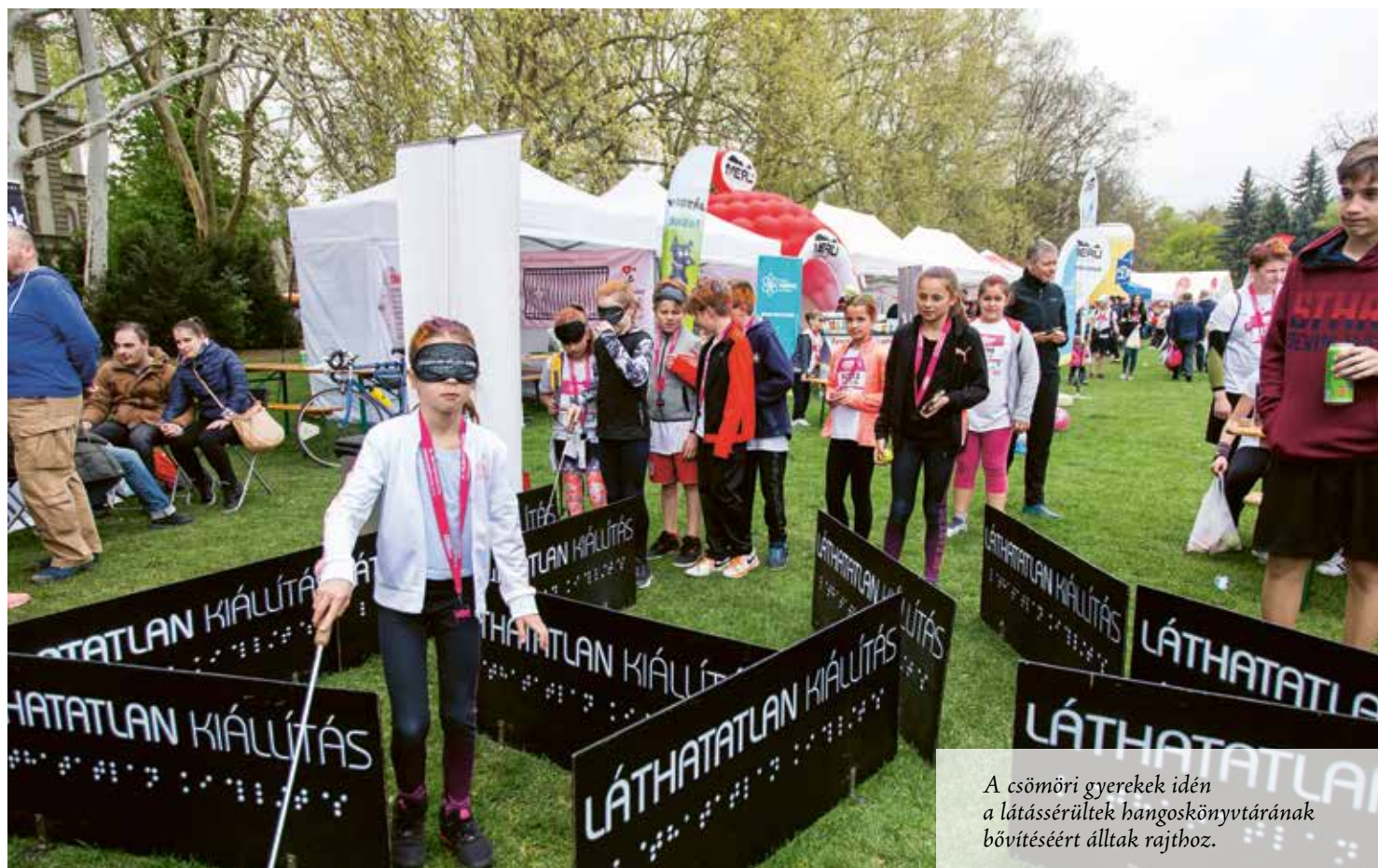
A csömöri gyerekek idén a látássérültek hangoskönyvtárának bővítéséért álltak rajthoz.