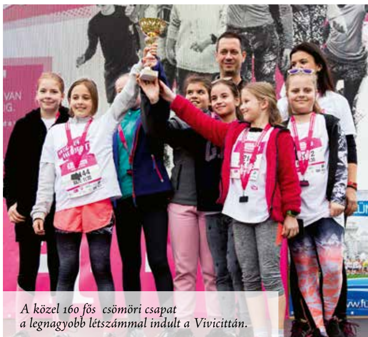
A közel 160 fős csömöri csapat a legnagyobb létszámmal indult a Vivicitán.