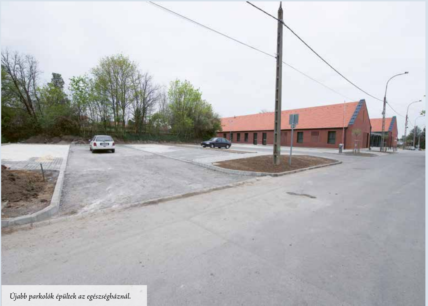
Újabb parkolók épültek az egészségháznál.