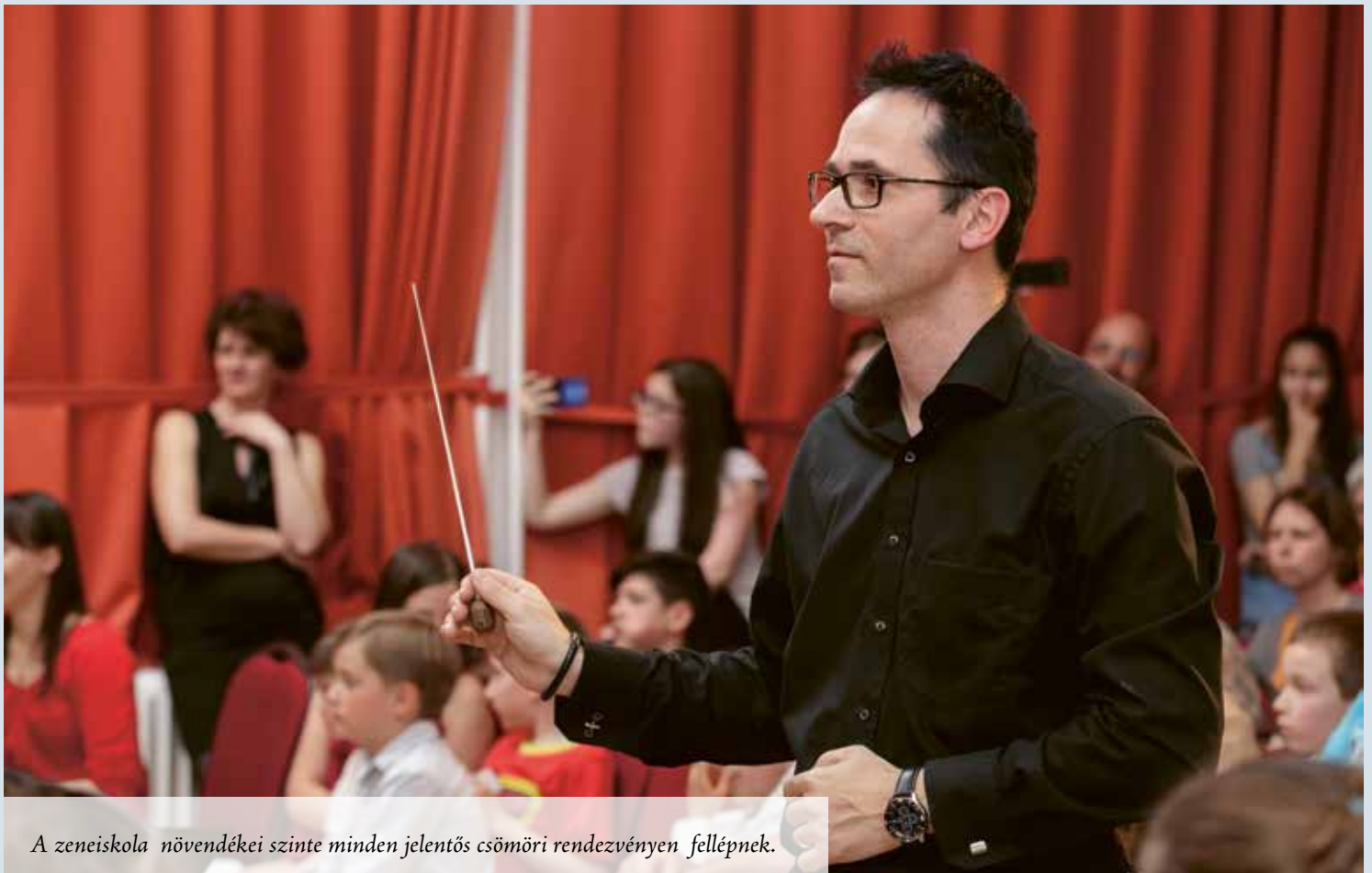
A zeneiskola növendékei szinte minden jelentős csömöri rendezvényen fellépnek.