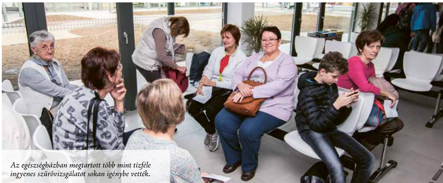
Az egészségházban megtartott több mint tízféle ingyenes szűrővizsgálatot sokan igénybe vették.

Olyan programot kerestünk mára, ami gyalog vagy biciklivel is megközelíthető, a Légy ott-ban találtam az Egészségnap programját. Mivel a szülések előtt egy rehabilitációs intézetben dolgoztam, ahol én voltam a szelektív hulladék felelőse, ezek az információk szerencsére nem teljesen újak számomra, de szívügyem a környezettudatosság. Az pedig nagyon tetszik, ahogy a gyerekek könnyed, zenés formában ismerkedhettek a témával.