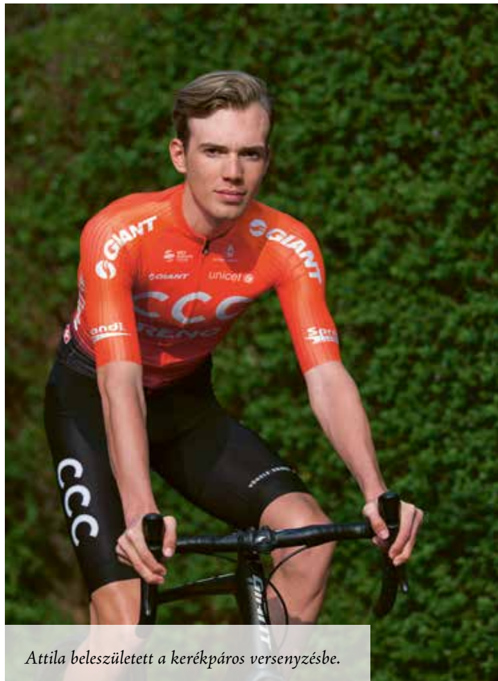
Attila beleszületett a kerékpáros versenyzésbe.