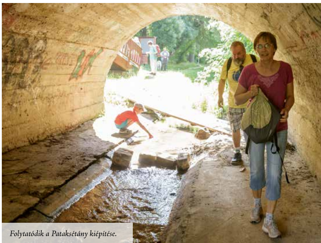
Folytatódik a Pataksétány kiépítése.

Néhány éve készült el a páratlanul szép Pataksétány, melynek első, a Bulgárkert és a Szabadság út közötti szakasza ma már közkedvelt sétahelyszín. A sétányon jelenleg a Jókai utcáig gyalogolhatunk végig, ám hamarosan a befejező szakasz is elkészül, így a Bulgárkerttől egészen a csömöri horgásztóig kisétálhatunk majd a patak mentén.