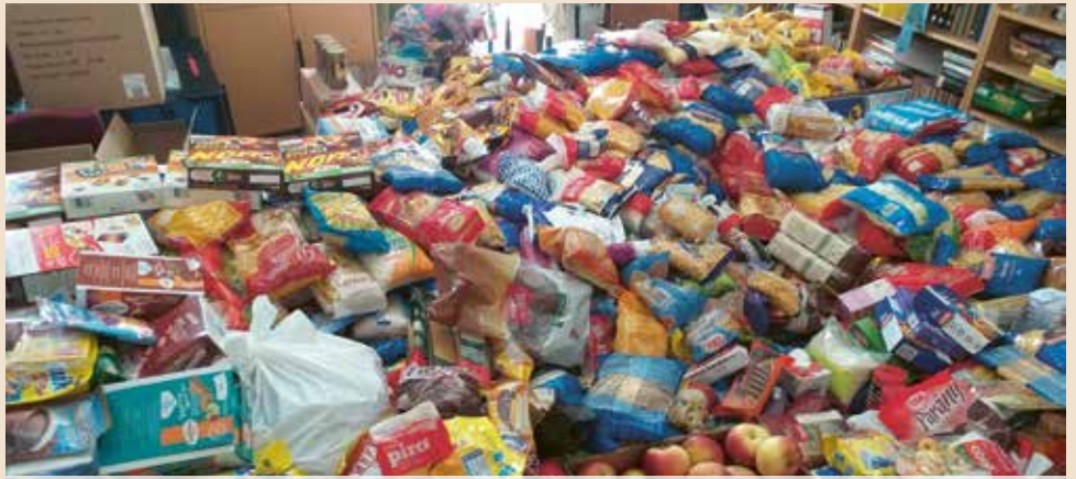
A csömöri vásárlók adományait húsvét előtt a Karitás juttatta el a rászoruló családokhoz.

Ezúton köszönjük minden kedves csömöri lakosnak a nagylelkű segítséget, amivel hozzájárultak ehhez az elképesztő sikerhez. Köszönjük továbbá Bokros Levente atyának, a csömöri római katolikus egyházközség tagjainak, valamint a Prima és a Coop áruházak vezetőinek, munkatársainak, hiszen nélkülük mindez csak álom maradt volna.