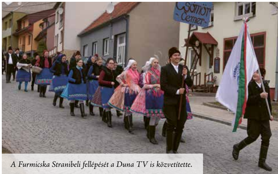
A Furmicska Stranibeli fellépését a Duna TV is közvetítette.

Stráni község a Fehér-Kárpátok alatt, közvetlenül Szlovákia és Csehország határán fekszik. Rendezvények alkalmával a falu, eredetileg 4000 főt számláló lakossága többszörös vendégereget lát el, mert ők rendezik már évek óta a farsangi tradíciók bemutatásáról ismert „Fašank” fesztivált, melyet idén március 1 – 5.