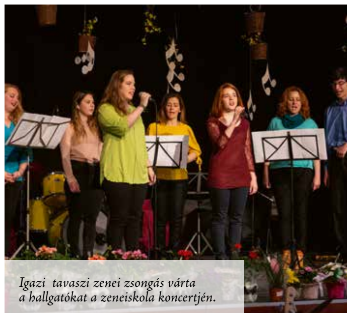
Igazi tavaszi zenei zsongás várta a hallgatókat a zeneiskola koncertjén.