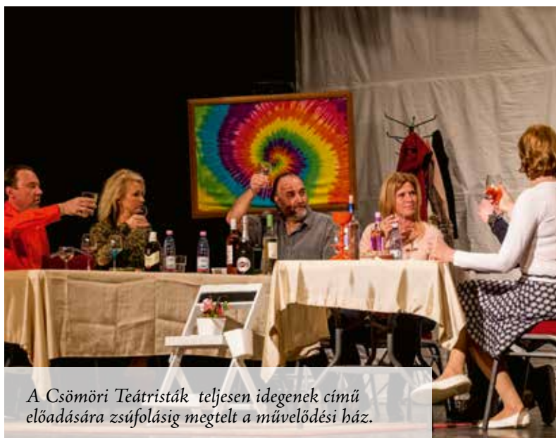
A Csömöri Teátristák teljesen idegenek című előadására zsúfolásig megtelt a művelődési ház.