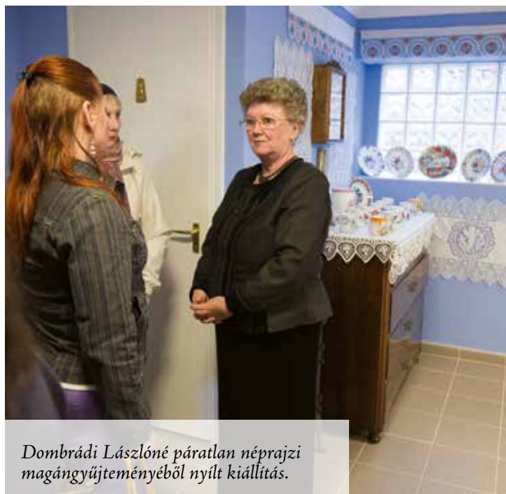
Dombrádi Lászlóné páratlan néprajzi magángyűjteményéből nyílt kiállítás.