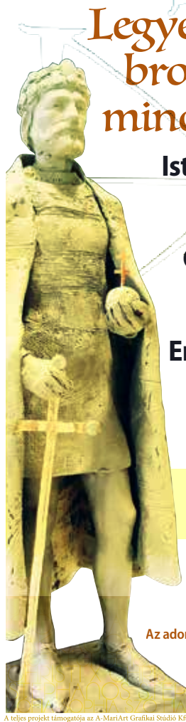
A teljes projekt támogatója az A-MariArt Grafikai Stúdió Kft