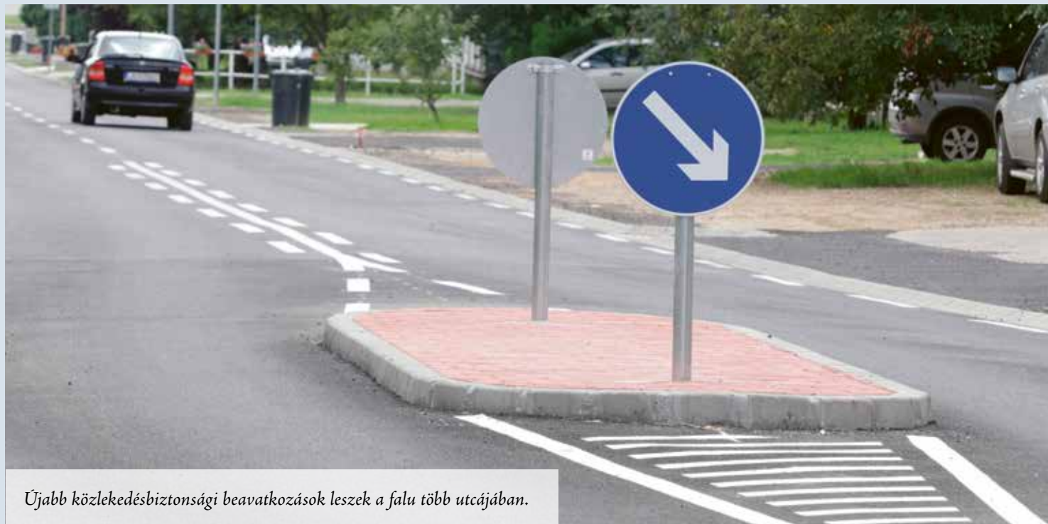
Újabb közlekedésbiztonsági beavatkozások lesznek a falu több utcájában.

BÁLINT GYÖRGY, közismert nevén Bálint gazda idén töltötte be 100. életévét. Bár Budapest XVI. kerületében él, erőteljesen kötődik Csömörhöz, mivel több mint