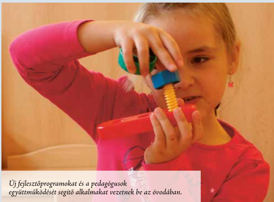
Új fejlesztőprogramokat és a pedagógusok együttműködését segítő alkalmakat vezetnek be az óvodában.