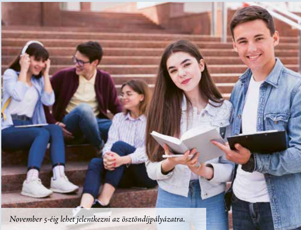
November 5-éig lehet jelentkezni az ösztöndíjpályázatra.

Ehelyett a járdát erősítenék meg, és korlátot építenének. Tervek és kivitelezői kapacitás hiányában azonban szükséges elhalasztani a döntést, amit a képviselő-testület jóváhagyott.