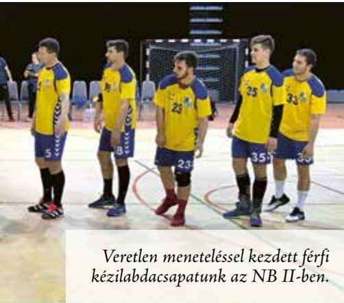
Veretlen meneteléssel kezdett férfi kézilabdacsapatunk az NB II-ben.