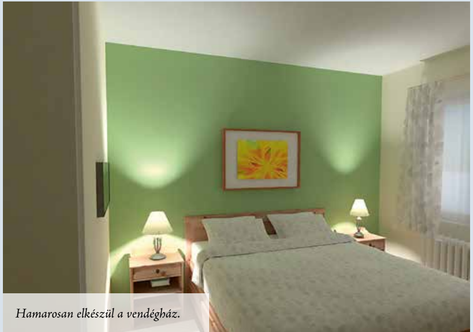
Hamarosan elkészül a vendégház.