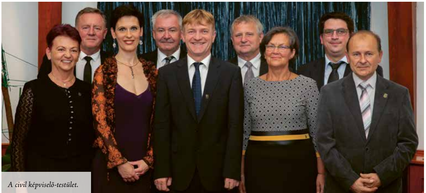
A civil képviselő-testület.

A képviselők, bizottsági tagok és tanácsnokok tiszteletdíját a következő, november 14-ei képviselő-testületi ülésen tárgyalják.