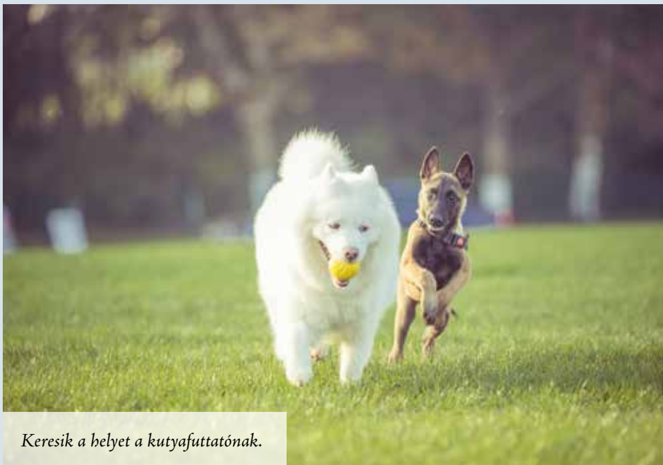
Keresik a helyet a kutyafuttatónak.

A költségvetési rendelet módosításait a képviselő-testület egyhangúlag, 9 igen szavazattal elfogadta.