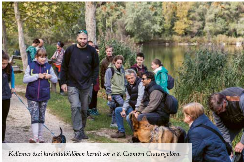
Kellemes őszi kirándulószerűen került sor a 8. Csömöri Csatangolóra.