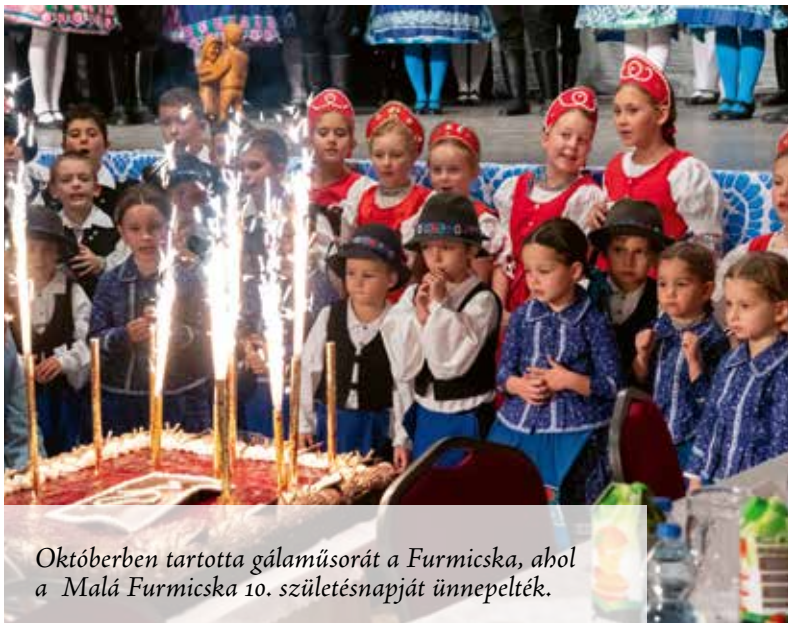
Októberben tartotta gálaműsorát a Furmicska, ahol a Malá Furmicska 10. születésnapját ünnepelték.