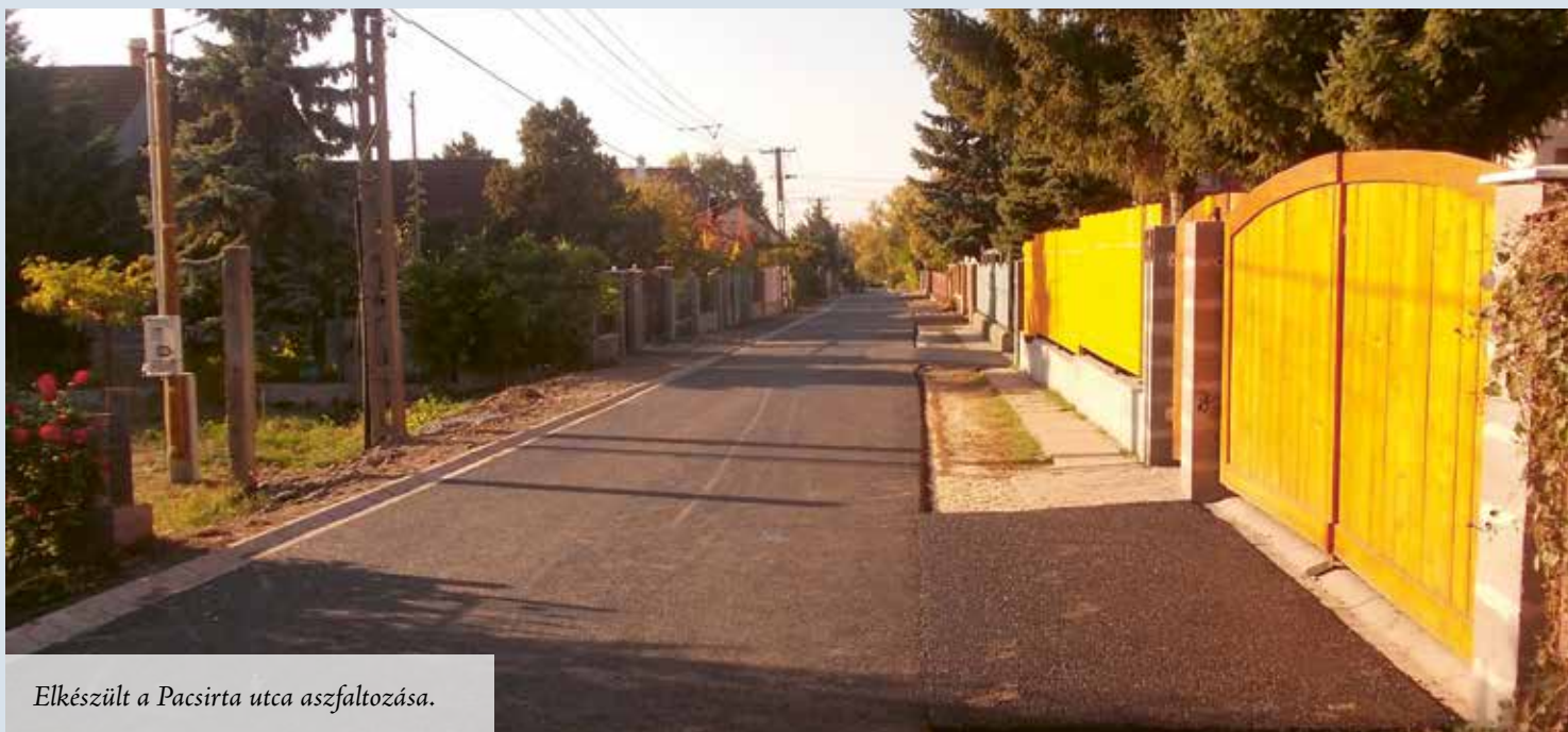
Elkészült a Pacsirta utca aszfaltozása.