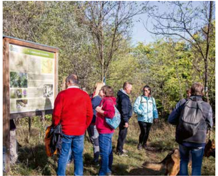
Közel háromszázan vettek részt a nyolcadikkal megrendezett Csömöri Csatnagoló gyalogos teljesítménytúrán.