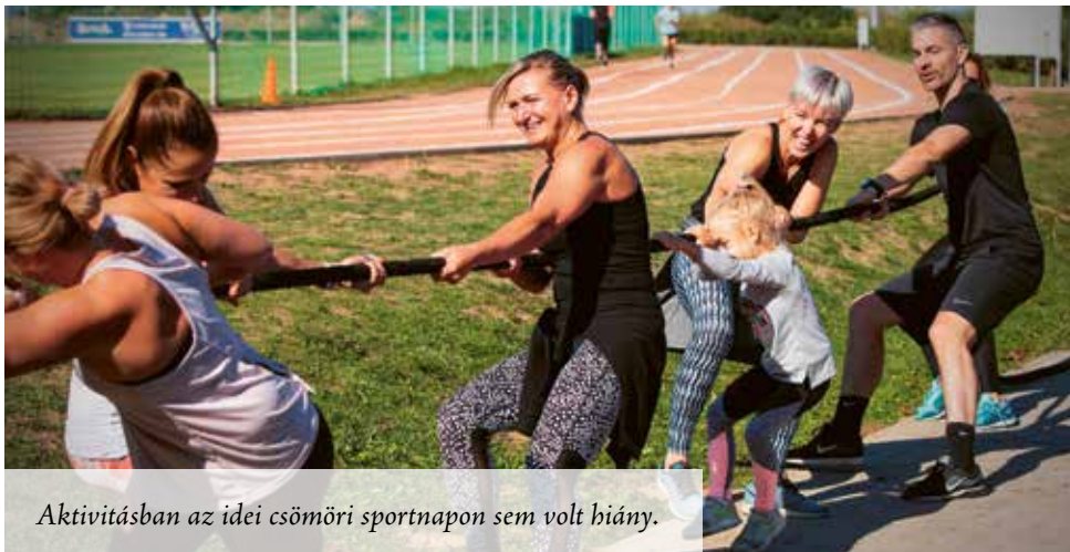
Aktivításban az idei csömöri sportnapon sem volt hiány.