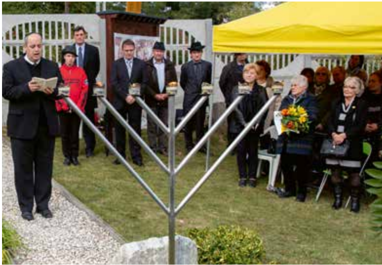
Október 6-án a holokauszt évfordulója alkalmából megemlékezést tartottak a csömöri zsidó sírkertben a MAZSIHISZ és az Élet Menete Alapítvány, valamint az önkormányzat támogatásával a ZSIT egyesület szervezésében.