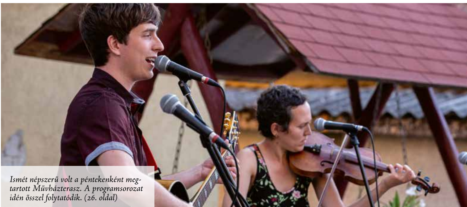
Ismét népszerű volt a péntekenként megtartott Művházterasz. A programsorozat idén ősszel folytatódik. (26. oldal)