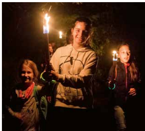
Ismét sokan vettek részt az éjszakai túrán.