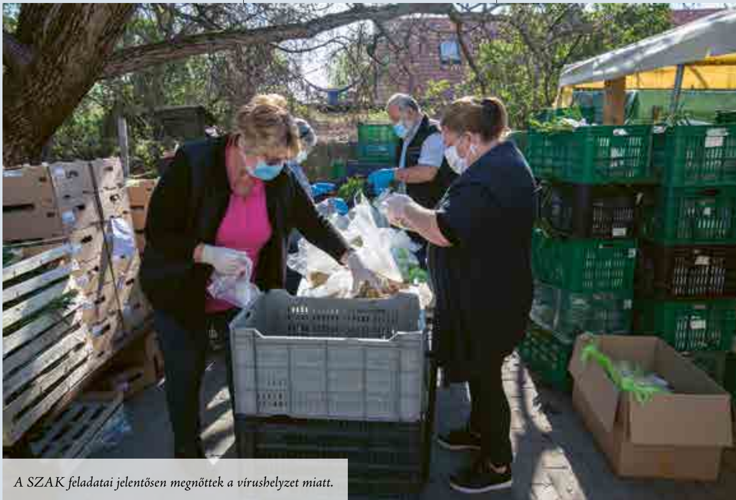
A SZAK feladatai jelentősen megnöttek a vírushelyzet miatt.