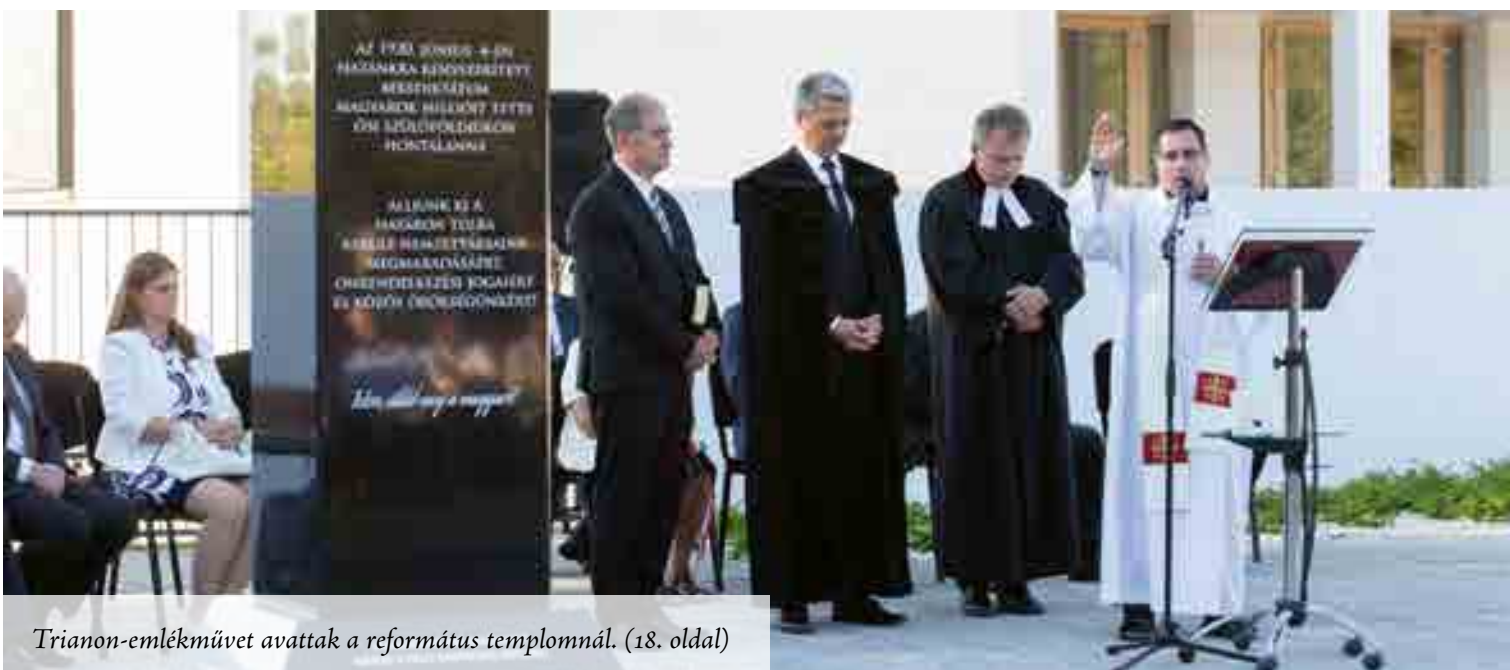
Trianon-emlékművet avattak a református templomnál. (18. oldal)