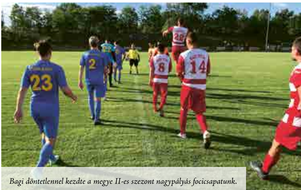
Bagi döntetlenel kezdte a megye II-es szezont nagypályás focicsapatunk.

Nyáron újjáalakult labdarúgócsapatunk Bagon rajtolt a megye II-es bajnokságban, tiszta kékben pályára lépő együttesünk közel öt hónapos kihagyást követően játszott ismét tétmérkőzést. A csömöri gárda már a 3. percben hátrányba került, a hazaiak furge jobbszélsője kihasználta a védelmünk bizonytalanságát. A szünetben kettőt is cserélt fiatal vezetőedzőnk, Dencz pályára kerülésével pedig egy csapásra veszélyesebbek lettünk a kapu előtt. Támadónk az 56. percben például remekül került helyzetbe, első lövését még védeni tudta az ellenfél kapusa, de másodszorra nem hibázott, pimaszul pöccintett a hálóba. A folytatásban a hosszú idő után visszatérő Tihanyi-ka-