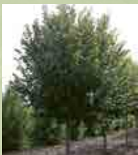
'Bori' ezüst hárs

Magasabbra növő fák (olyan helyekre, ahol nincs légvezeték):