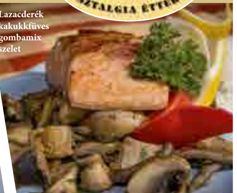
Lazacderék kakukkfűves gombamix szelet