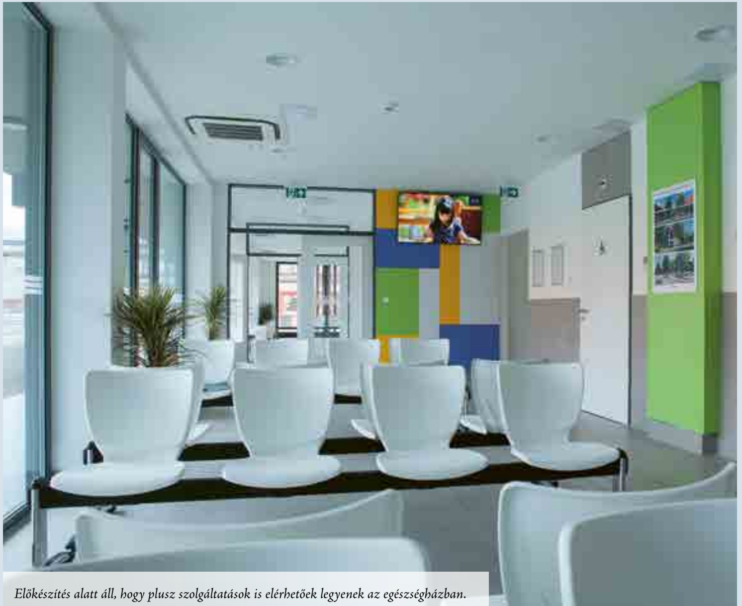
Előkészítés alatt áll, hogy plusz szolgáltatások is elérhetőek legyenek az egészségházban.

A szakértő emellett kitért a koronavírus-járvány elleni védekezés lehetőségeire is. Kifejtette, hogy a tavaszi hullám idején a csömöri önkormányzat példaértékű módon reagált, ennek köszönhetően a településen a járvány szinte egyáltalán nem jelent meg. Képviselői kérdésre kifejtette, hogy Csömörnek lehetősége van annak a vizsgálatára, hogy a szennyvízben milyen mértékben van jelen a vírus, hiszen saját szennyvíztisztítóval rendelkezik, a mintavételezés lehetősége is adott, a minták bevizsgálásához azonban speciális laborkapacitás szükséges.