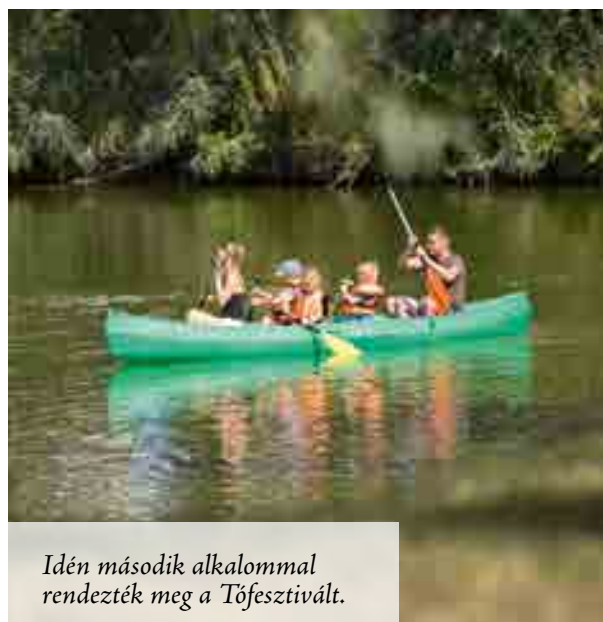
Idén második alkalommal rendezték meg a Tőfesztiált.