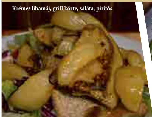
Krémes libamáj, grill körte, saláta, piritós