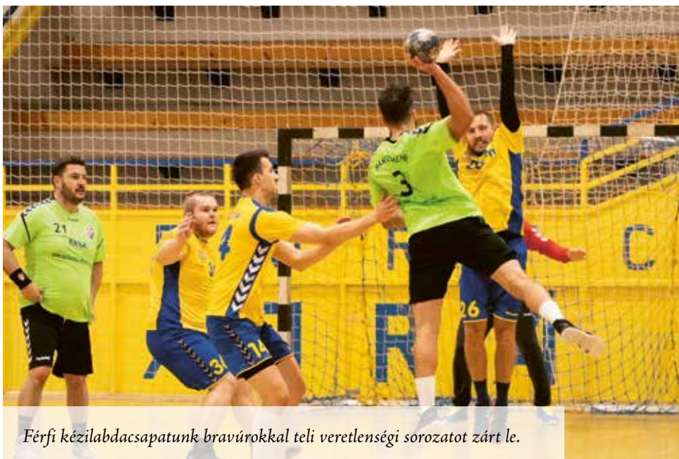
Férfi kézilabdacsapatunk bravúrokkal teli veretlenségi sorozatot zárt le.