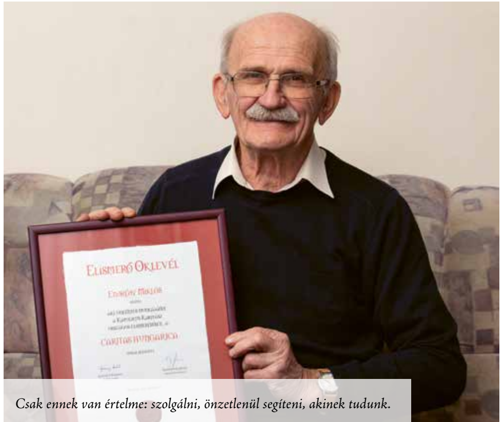
Csak ennek van értelme: szolgálni, önzetlenül segíteni, akinek tudunk.

Alapítótágok voltunk 2013-ban, de már az azt megelőző előkészítő munkában is részt vettünk. Mások segítése mindig nagyon fontos volt számra, azt gondolom, a gyerekkoromig kell visszautazni az időben, ha ennek okát keressük. 1944-ben születtem és Kunszentmiklóson nőttem fel. Édesapám részt vett az 1956-os eseményekben, utána börtönbe került, és ott is halt meg Márianosztrán 1959-ben. Édesanyám magára maradt négy gyermekkel, én voltam a harmadik. Az ő helyzete sem volt könnyű, hiszen édesapám feleségként nem kapott egykönnyen munkát. A város lakói rengeteget segítettek nekünk. Tisztán emlékszem arra az esetre, amikor iskolába menet egy asszony megfogta a kezem, és azt mondta, adjak neki egy üres kosarat. Aznap este