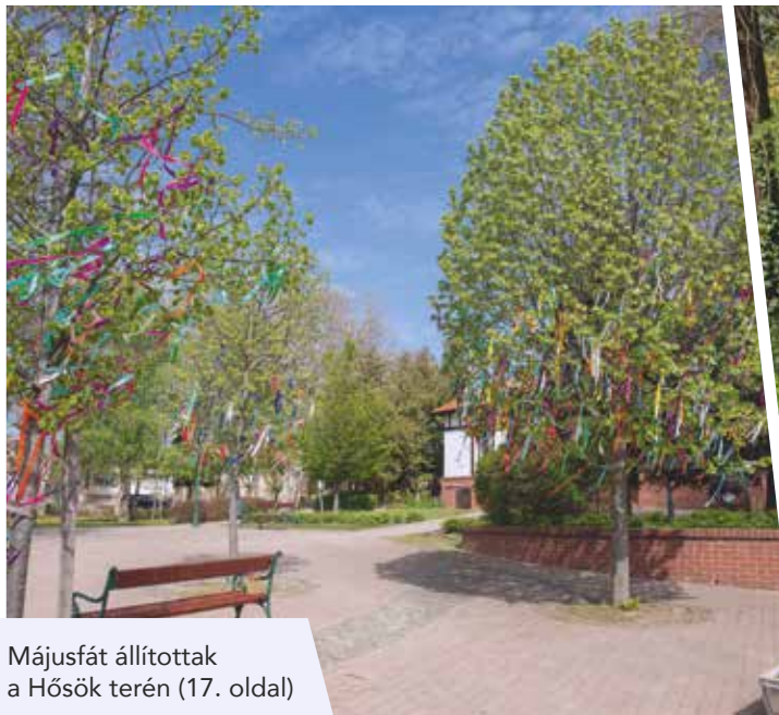
Májusfát állítottak a Hősök terén (17. oldal)