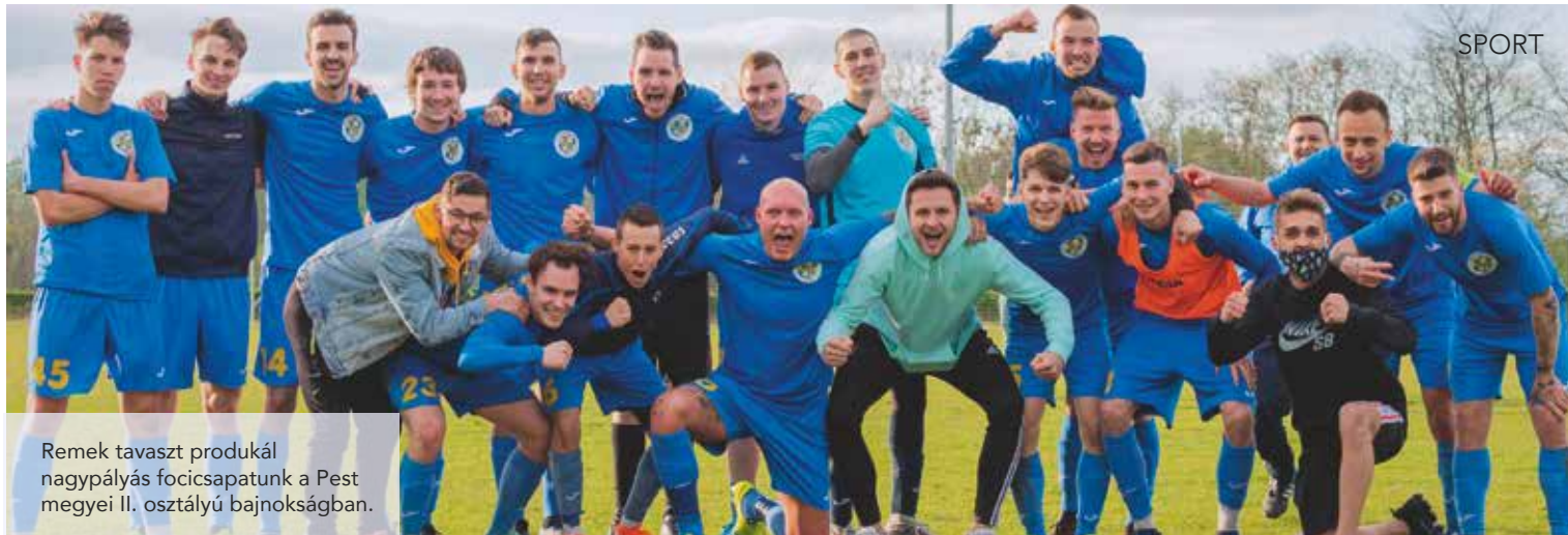
Remek tavaszt produkál nagypályás focicsapatunk a Pest megyei II. osztályú bajnokságban.