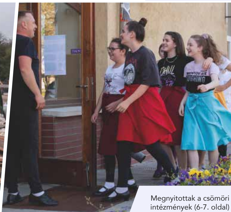
Megnyitottak a csömöri intézmények (6-7. oldal)