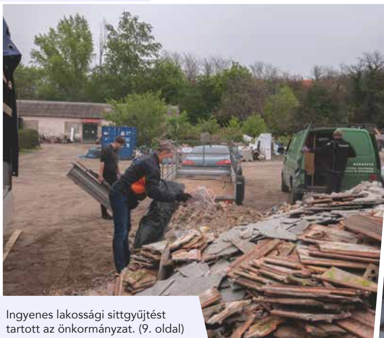
Ingyenes lakossági sittgyűjtést tartott az önkormányzat. (9. oldal)