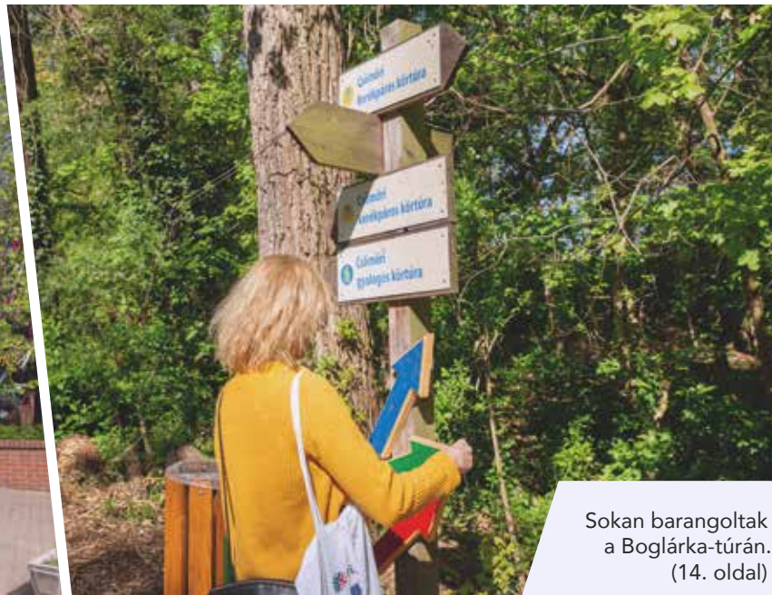
Sokan barangoltak a Boglárka-túrán. (14. oldal)