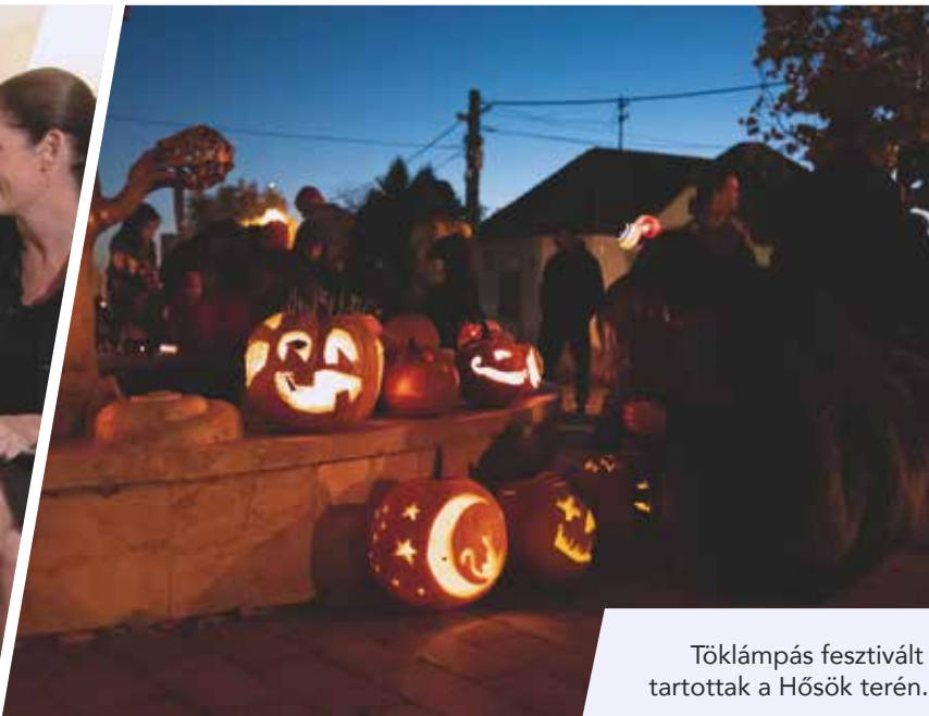
Töklámpás fesztivált tartottak a Hősök terén.