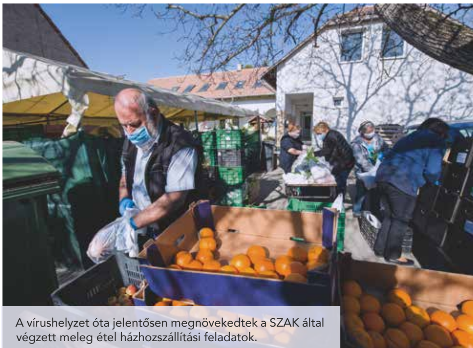
A vírushelyzet óta jelentősen megnövekedtek a SZAK által végzett meleg étel házhozszállítási feladatok.