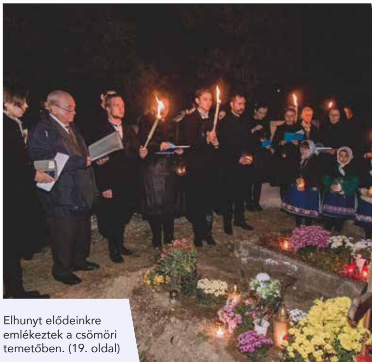
Elhunyt elődeinkre emlékeztek a csömöri temetőben. (19. oldal)