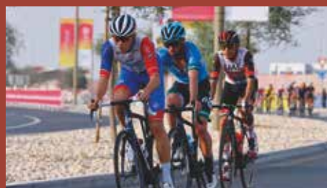
A sportrovatot összeállította: Szabó Péter Ádám

A legaktívabb csömöri Az olasz országúti kerékpáros körverseny főszervezője Giro d'Italia Criterium Expo 2020 Dubai néven szervezett kritériumversenyt az Egyesült Arab Emírségek legismertebb városában. Az expo keretein belül egy 2,1 kilométeres pályán kellett 30 kört megtennie a versenyzőknek, amelyet úgy alakítottak ki, hogy az pont az Amore Infinitót, azaz a Giro logóját szimbolizálja a magasból. Büszkeségünk végig mutatta magát a viadalon, többször is próbálkozott szökéssel, minek eredményeképpen végül kiérdemelte a legaktívabb versenyzőnek járó különdíjat.