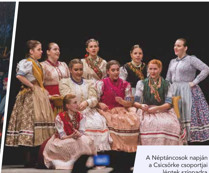
A Néptáncosok napján a Csicsörke csoportjai léptek színpadra.