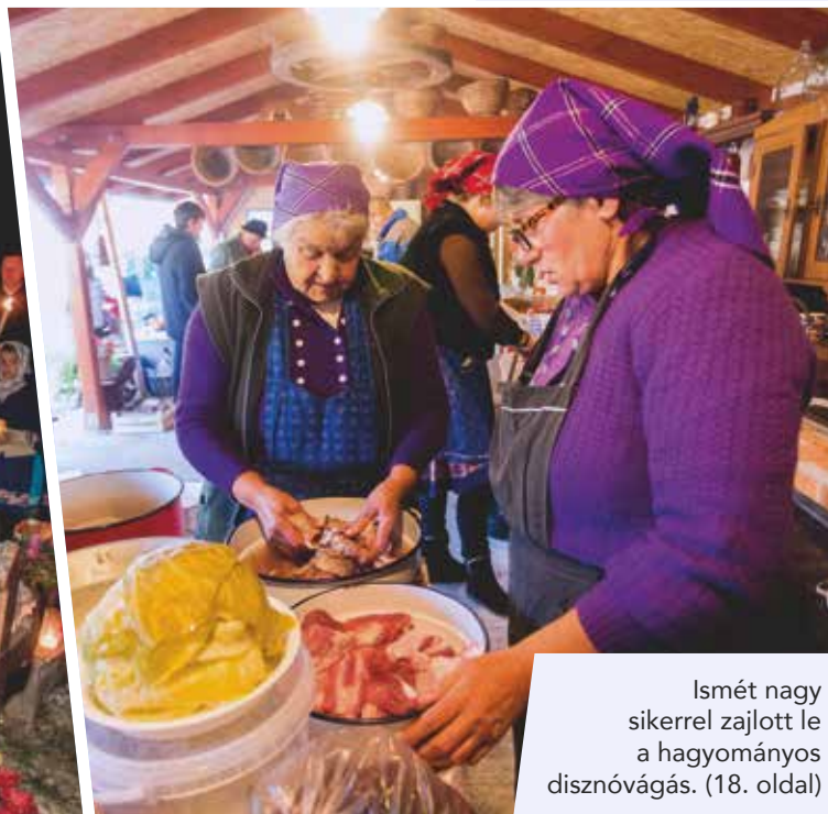
Ismét nagy sikerrel zajlott le a hagyományos disznóvágás. (18. oldal)