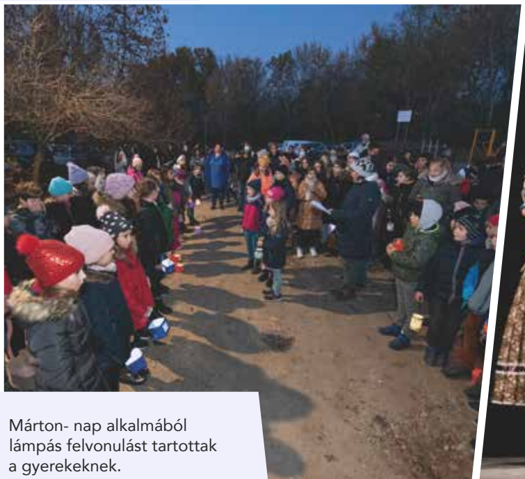
Márton- nap alkalmából lámpás felvonulást tartottak a gyerekeknek.