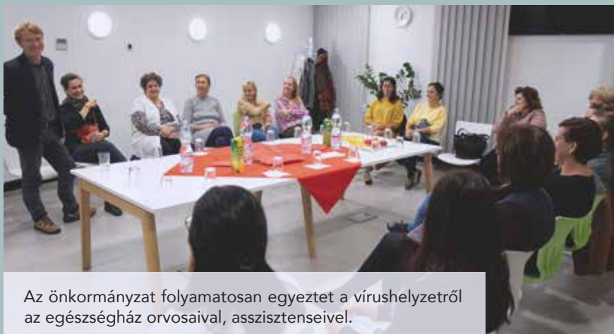
Az önkormányzat folyamatosan egyeztet a vírushelyzetről az egészségház orvosaival, asszisztenseivel.

Az önkormányzat idén is több millió forintot költ saját költségvetéséből a vírus elleni védekezésre. Ősszel két alkalommal az önkormányzati intézmények dolgozói és az egészségügyi munkatársak mellett az egyházi óvoda, illetve az állami általános- és zeneiskola pedagógusainak, dolgozóinak is szerveztek a harmadik oltás előtt ellenanyagszűrést, illetve továbbra is biztosítják a vírus elleni védekezéshez szükséges eszközöket. Ugyanakkor a pedagógusok bérkiegészítésére is sokat költenek, így azoknak, akik a vírus miatt kerültek betegállományba, és nem tudják érvényesíteni a központi támogatást, az önkormányzat saját költségvetéséből bérkiegészítést nyújt.