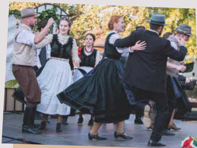
A Furmicska és a Csicsörke néptáncosai is ropták a színpadon.