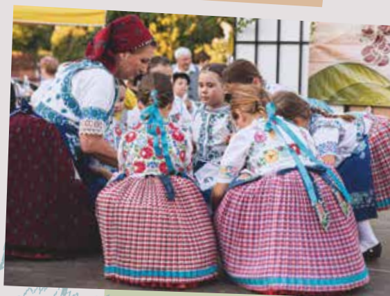
A közönség nagy öröme a Furmicska egy gyermekcsoportja is felzárkózhatott és a felnőtt csoportok mellett bemutatkozhatott az idei Szüreti mulatságon. A gyerekek szép csömöri viseletben, egy helyi kötődésű koreográfiát mutatták be, aminek címe „Válasszunk bírót Csömörön!” A gyermekek játékosan táncolták és énekeltek el a bíróválasztást. Énekeik és táncaik a régmúlt szüreti mulatságok hangulatát idézték.