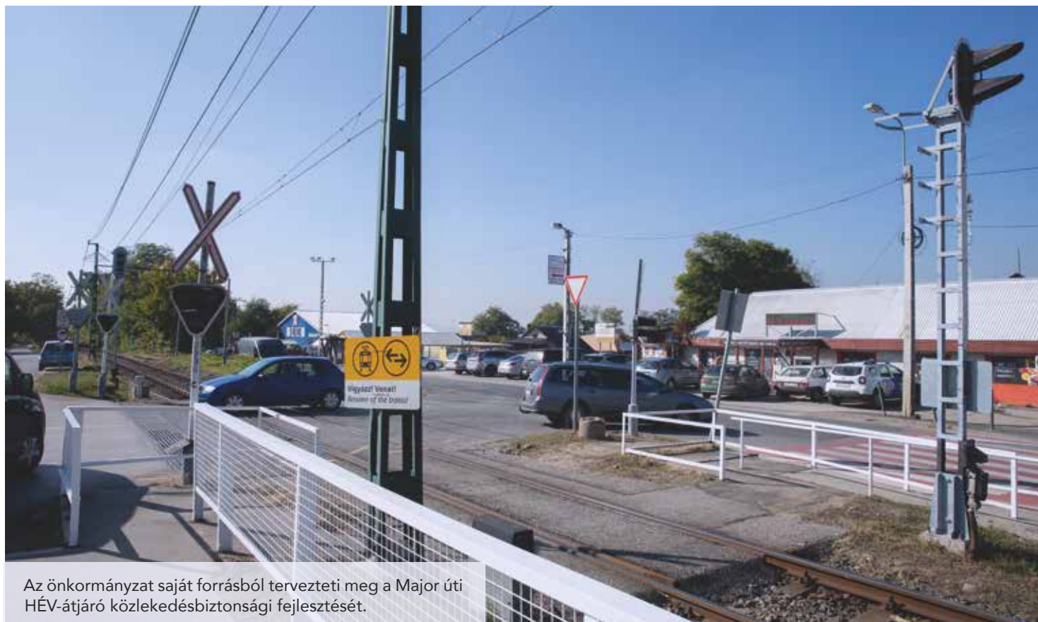
Az önkormányzat saját forrásból tervezeti meg a Major úti HÉV-átjáró közlekedésbiztonsági fejlesztését.