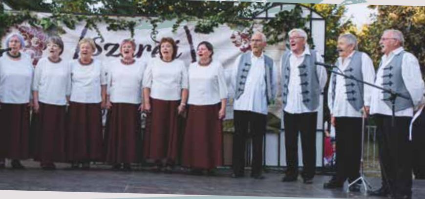
A Tiszta Forrás és a Báló Lipót Népdalkör előadását is meghallgathatta a közönség.