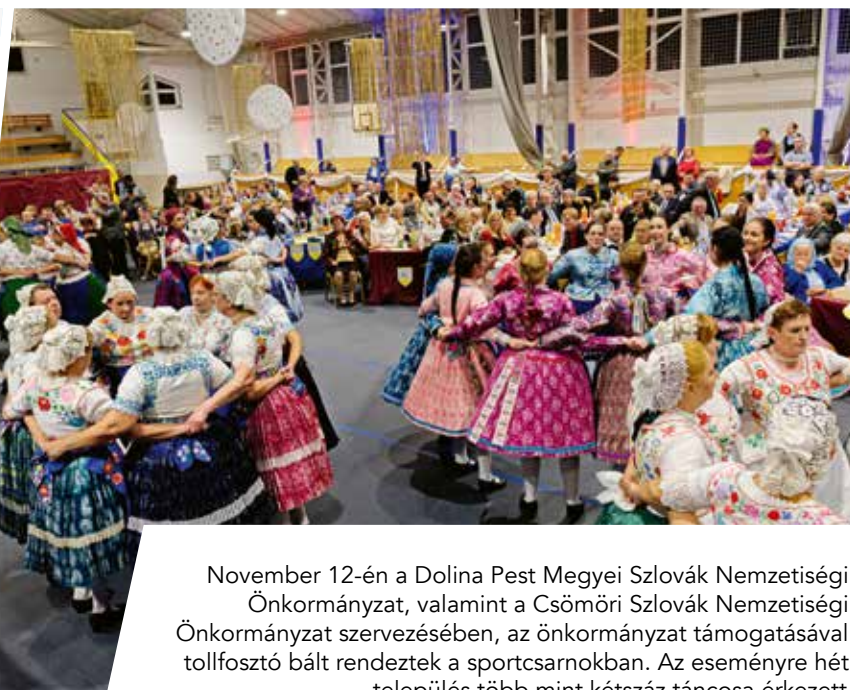
November 12-én a Dolina Pest Megyei Szlovák Nemzetiségi Önkormányzat, valamint a Csömöri Szlovák Nemzetiségi Önkormányzat szervezésében, az önkormányzat támogatásával tollfeszítő bált rendeztek a sportcsarnokban. Az eseményre hét település több mint kétszáz táncosa érkezett.