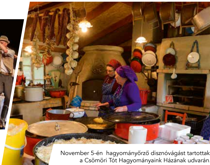
November 5-én hagyományőrző disznóvágást tartottak a Csömöri Tót Hagyományaink Házának udvarán.