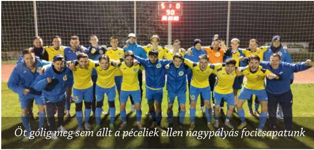
Öt gólig meg sem állt a péceliek ellen nagypályás focicsapatunk

A piliscsabaiak és a péceliek elleni hazai mérkőzést magabiztosan nyerte meg nagypályás focicsapatunk, Kistarcsán azonban az elmúlt évekhez hasonlóan most sem sikerült a bravúr. Ezzel együtt az őszi szezon hajrája előtt a gárda előrelépett a Pest megyei II. osztályú bajnokságban a tabella negyedik helyére!