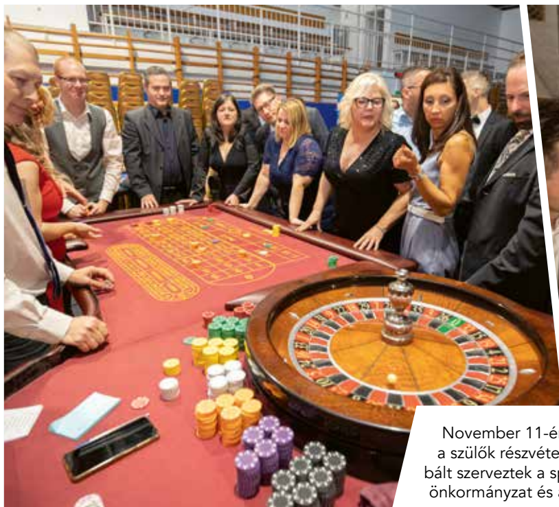
November 11-én az általános iskolai tanárai és a szülők részvételével Márton-napi jótékonysági bált szerveztek a sportcsarnokban. A rendezvény az önkormányzat és a szülők támogatásával jött létre.