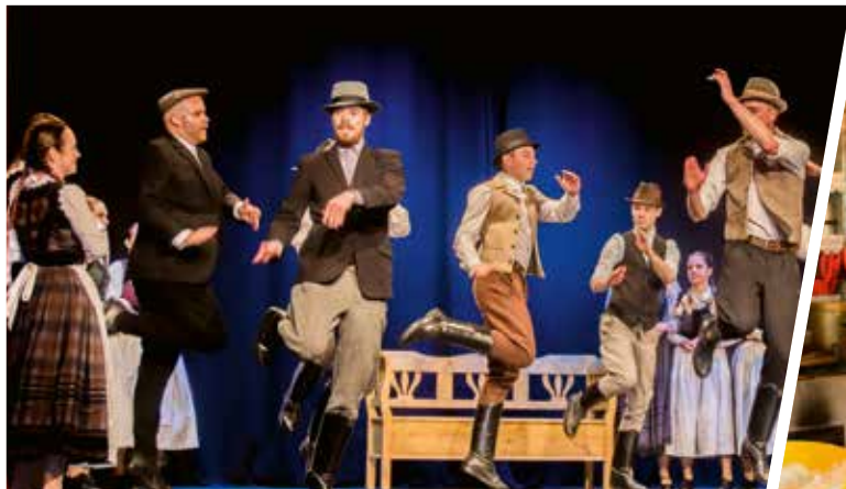
November 5-én „Lágy sóvárgás” címmel tartott bemutató előadást a Csicsörke Néptáncgyűttes a művelődési házban. A műsorban a táncgyűttes utánpótlás és felnőtt csoportjai mellett az isaszegi Csata Táncgyűttes lépett színpadra.