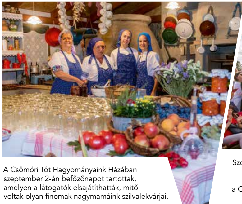
A Csömöri Tót Hagyományaink Házában szeptember 2-án befőzőnapot tartottak, amelyen a látogatók elsajátíthatták, mitől voltak olyan finomak nagymamáink szilvalekvárjai.