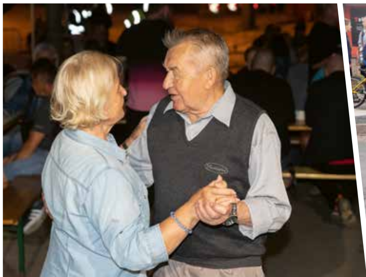
Szeptember 10-én tartották a Béke téri esték rendezvényt a Vox Animi Vegyeskar és a Felvári söröző szervezésében. A programban a Csömöri Ifjúsági Fúvószenekar, a Vox Animi Vegyeskar és a Kramer Big Band lépett fel, a tánczenét a Korona Trió biztosította. A rendezvény az önkormányzat támogatásával jött létre.