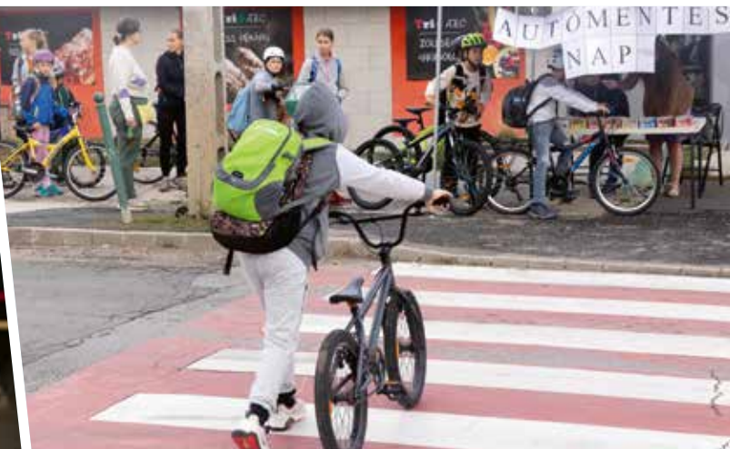
Szeptember 16-án tartotta meg az önkormányzat az idei tanév első autómentes napját a helyi általános iskolás gyerekek számára. A mintegy hat éve, évente többször megtartott akció során közel négyszáz gyermek érkezett autó nélkül iskolába. A gyalogosan, rollerral vagy kerékpárral iskolába igyekvő gyerekeket az önkormányzat munkatársai – a hagyományokhoz híven – apró ajándékokkal várták.