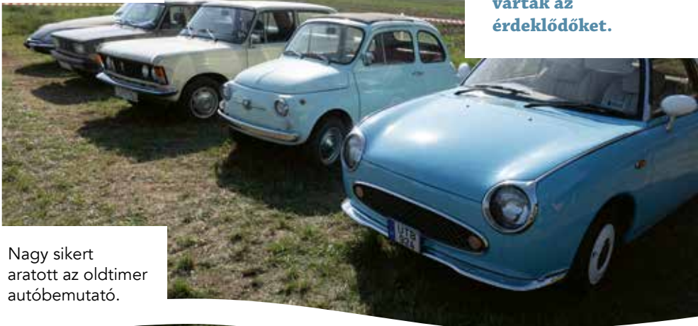
Nagy sikert aratott az oldtimer autóbemutató.

Augusztus 27-én rendezték meg a IV. Csömöri Tófesztivált a Csömöri Horgásztónál. Az egész napos nyárbúcsúztató rendezvényen koncertek és színes gyermekprogramok várták az érdeklődőket.