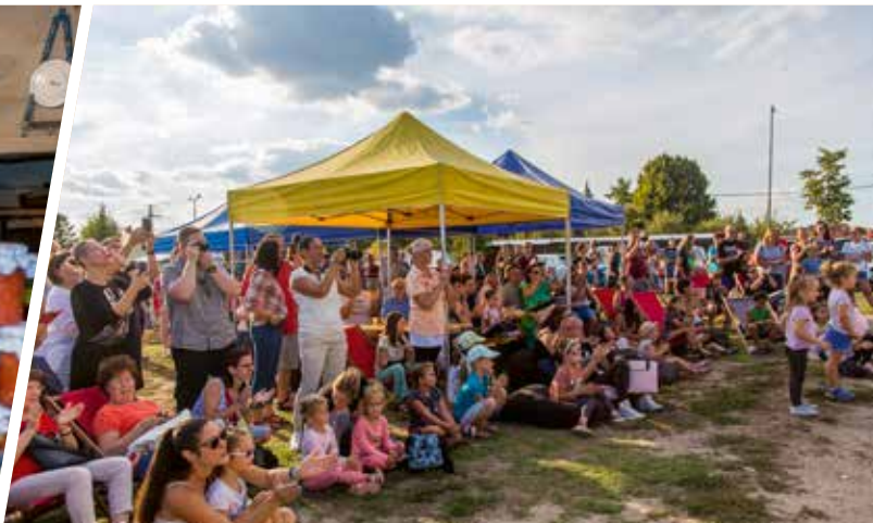
Szeptember 3-án rendezték meg a Középhegyi pikniket a Laky-parkban, ahol gyermekprogramokkal és koncerttel várták az érdeklődőket az önkormányzat és a művelődési ház szervezésében. Az eseményen a Csömöri Civil Egyesület, a Tere-Fere Klub tagjai, valamint a Vízműsor utca és a Hortenzia utca lakói finom ételekkel várták a látogatókat.