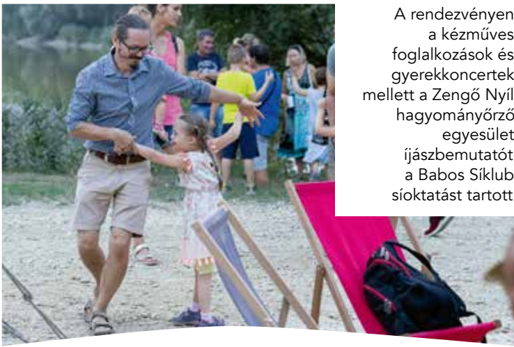
A rendezvényen a kézműves foglalkozások és gyerekkoncertek mellett a Zengő Nyíl hagyományőrző egyesület íjászbemutatót, a Babos Síklub síoktatást tartott.