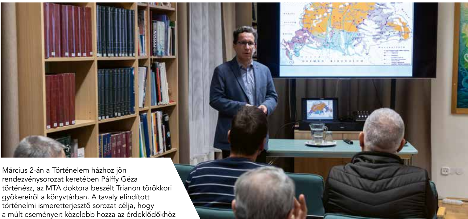
Március 2-án a Történelem házhoz jön rendezvénytársulat keretében Pálffy Géza történész, az MTA doktora beszélt Trianon törökkori gyökereiről a könyvtárban. A tavaly elindított történelmi ismeretterjesztő sorozat célja, hogy a múlt eseményeit közelebb hozza az érdeklődőkhöz