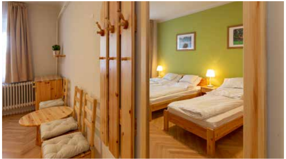
Energetikai fejlesztés keretében új, korszerű fűtést alakítanak ki a vendégházban