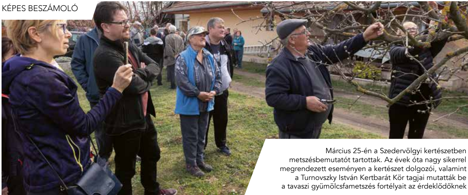
Március 25-én a Szedervölgyi kertészetben metszésbemutatót tartottak. Az évek óta nagy sikerrel megrendezett eseményen a kertészet dolgozói, valamint a Turnovszky István Kertbarát Kör tagjai mutatták be a tavaszi gyümölcsfametszés fortélyait az érdeklődőknek